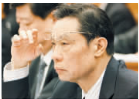
鍾南山籲代表暢所欲言贏得掌聲。

兩會進入尾聲，代表委員們十幾天來積極參政議政的場面讓人真切感受到國家政治生活的日漸開放和進步，然而也有少數人的不佳表現令媒體和網民失望，兩會人士對此亦有批評，指部分代表空話太多，全國政協委員韓美林更直言，政協不是要錢的地方，委員獻計獻策但不能獻媚。 商報綜合報道