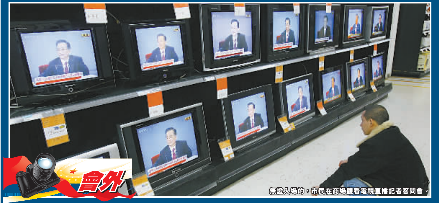
無證入場的，市民在商場觀看電視直播記者會。