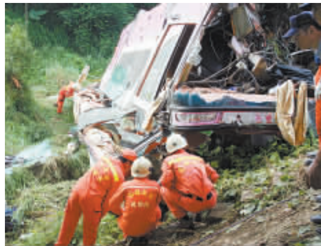
台高雄縣遊覽車失事救助隊在搜索。

【商報訊】台北消息：昨日清晨，台灣中南部高速公路接連發生兩起交通事故，一起發生在高雄縣，一遊覽車衝下高速公路邊坡，車內包括駕駛和乘客在內有28人，其中7人不幸死亡；另一輛廂型車，行經彰化縣境內高速公路時翻覆，造成2人死亡。