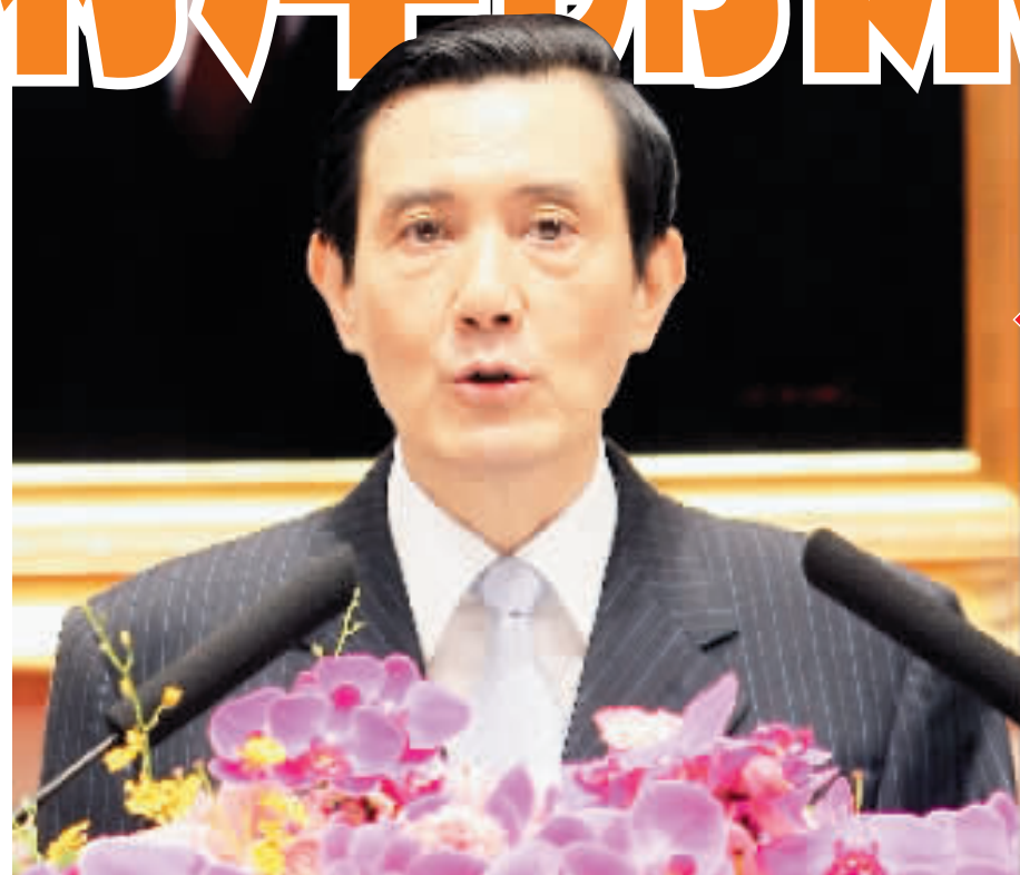
馬英九昨日發表講話強調，未來將致力重建兩岸關係，並接受監督。

徐純芳並說，希望ECFA今年雙邊可完成共同研究，進入協商階段；倘順利執行前述作業規劃，明年初春可望告一段落，進行簽約。