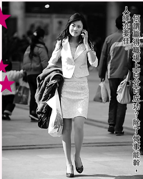
何謂職場上百分百成功？除了做事能幹，人緣亦要佳。

有個人，每天在花田中工作超過十小時，回到家又要做家務，照顧家中每一個人。偶然間發現家人的襯衫破了，翌日就買了新衣回來。而在駕車回家途中，還自己動手修理突然故障的車輛。這故事給你的感覺是？