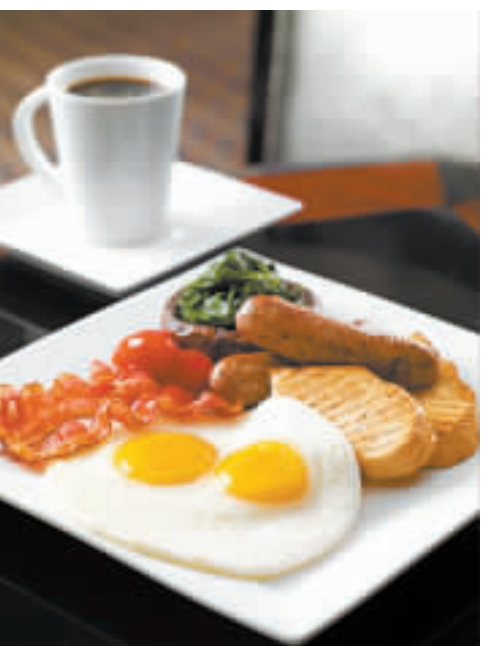
▲ Main St. Deli 提供的 All day breakfast 分量豐富。