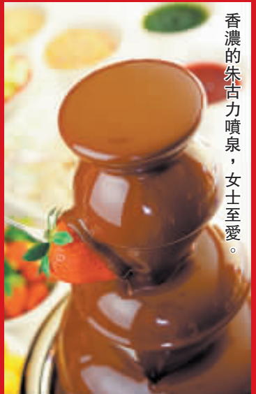
香濃的朱古力噴泉, 女士至愛。

供應時間: 星期日及公眾假期中午 12 時至下午 2 時 30 分 收費: 成人$198、小童$148 地址: 九龍彌敦道 380 號香港逸東酒店 4 樓