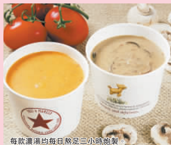
每款濃湯均每日熬足三小時炮製。

踏入秋冬季, 不少食品也會忽然變得受歡迎, 上述介紹的火鍋如是, 熱騰騰的湯水亦如是。最近 Pret A Manger 推出了五款全新窩心濃湯, 全部均以新鮮有機食材熬足三小時炮製, 滋味暖胃。