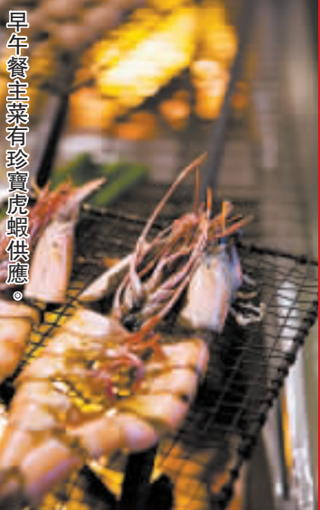
早午餐主菜有珍寶虎蝦供應。

早午餐的前菜及沙律採用自助形式, 包括照燒鴨配日本包心菜、蟹肉配冷麵、烤秋刀魚配蔬菜及新鮮豆腐味噌湯等, 還有各款新鮮出爐的爐端炭燒。而開放式壽司吧的選擇種類繁多, 除三文魚、香辣吞拿魚卷壽司外, 亦有 Zuma 招牌卷壽司拼盤, 款式應有盡有。主菜有多款選擇, 如珍寶虎蝦、燒羊架等, 最後奉上令人垂涎三尺的甜品拼盤作完美總結。