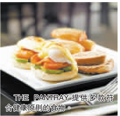
THE PANTRAY 提供多款符合健康原則的食物。

上周四才正式開張的 THE PANTRAY, 以時尚簡約概念為藍本。店內的工作人員笑容親切, 令筆者對這家餐廳留下好印象。據經理 Betty 介紹, 顧客享用 All Day Breakfast 可從九款食物中自選六款, 包括挪威煙三文魚、德國牛肉腸、德國豬肉腸、美國番茄、煙肉、薯仔、意大利火腿、炒蘑菇等, 然後再選出自己喜愛的雞蛋製