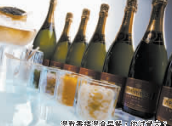
邊歡香檳邊食早餐, 你試過未?