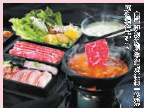
東星海鮮龍蝦牛鍋底任何一款湯底也相當吸引。

不少酒樓均以一個特定價錢的任食火鍋作招徠, 然而埋單的時候, 帳單上的銀碼永遠比那個特定價錢高出近一倍, 原因, 是火鍋的湯底、配料、醬油全部另計, 而且食物質素只屬一般, 反而連鎖快餐店的「一人一鍋」火鍋不但明碼實價, 而且往往予人驚喜。大家樂最近推出的火鍋, 以韓國泡菜及有機黃豆炮製出「紅白雙子鍋」——泡菜牛肉湯底及香濃豆乳湯底, 前者以秘製韓式辣醬混合牛腩、蒜、蘿蔔等熬上數小時, 辛辣、香濃、惹味; 後者則以石磨豆乳配合清酒、醬油、味噌等熬製, 清新香甜。兩款湯底分別可配東星斑穀飼肥牛、穀飼肥牛、穀飼肥牛腩肉、穀飼肥牛雜錦及豚肉雜錦五款新鮮配料, 每客只售 $43 起, 加配泰式青檸冰、山楂酸梅冰、鮮果特飲等只需 $6 一杯, 雖然不是任食任飲, 不過吃完後包保不會有被騙的感覺。 文: Carick