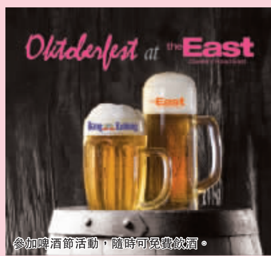
參加啤酒節活動, 隨時可免費飲酒。

每年十月舉行的德國啤酒節, 向來是德國人的周年盛會。為將這個盛會帶到香港, 由 King Ludwig Beerhall 主辦的德國啤酒節, 將在十月十六日起假灣仔皇后大道東 the East (合和中心、QRE Plaza、GARDENEast 及胡忠大廈) 舉行, 實行將合和中心地下的露天廣場變身為巴伐利亞式的盛大派對場地, 配以德國美食及啤酒, 令十月的皇后大道東充滿節日氣氛。