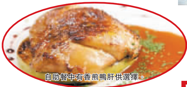
自助餐中有香煎鴨肝供選擇。

馬哥孛羅香港酒店 CUCINA 推出的醉人香檳早午餐, 讓你在周日醒來, 可一邊品嚐香檳, 一邊享受美食。自助餐提供超過三十款美味頭盤、沙律及餐湯, 包括意大利風乾肉、三文魚沙律、青口沙律、北京填鴨沙律、中式點心、海鮮湯麵、龍蝦麵豉湯、香煎牛柳及煙三文魚等。此外, 新鮮空運到港的海鮮拼盤及香煎鴨肝, 更是「回本」首選。最後, 令人目不暇給的甜品, 如各式歐洲芝士、芝士餅、生果撻、蘋果批伴雲呢拿雪糕等, 必能滿足你的食慾。