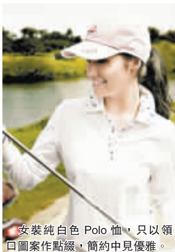
安裝純白色 Polo 恤，只以領口圖案作點綴，簡約中見優雅。