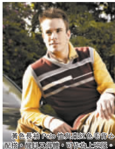
黃色長袖 Polo 恤與棗紅色毛背心搭配，醒目又得體，可作為上班服。