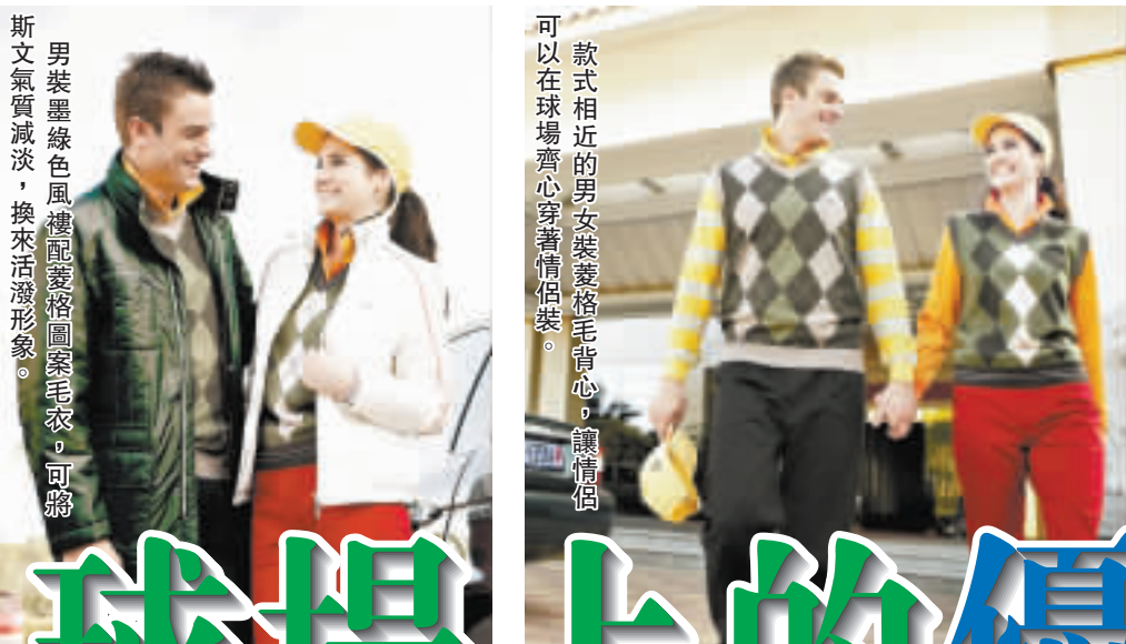
男裝墨綠色風褸配駁格圖案毛衣，可將斯文氣質減淡，換來活潑形象。

一直以來，打高爾夫球也是減壓或聯誼的最佳活動，而球手除了重視球具的質素，其實他們也對身上的服飾十分著緊。02年起便進駐亞太區的 King Gibson (金活吉遜)，雖然以高爾夫球用品系列最廣為人識，其實品牌的服飾亦同樣引人注目。品牌的秋冬服飾系列以和諧用色為主，加上設計優雅，讓人輕易可在球場施展魅力，即使是在日常場合穿著亦相當得體。 文：Suki