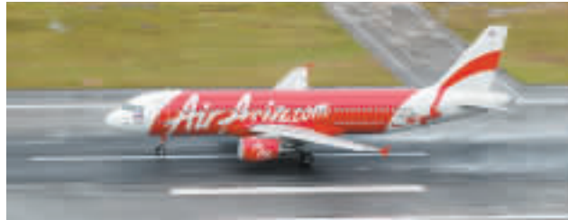
▲亞洲航空經營130條航線，全面性服務網絡遍及超過65個航點。

為了慶祝新航線，航空公司推出超低價機票優惠，單程票價低至港幣$228，今日為最後一日訂購日期，而旅遊日期為11月15日至2010年7月31日。顧客可透過網站www.airasia.com或透過手機上網mobile.airasia.com訂購。 蕭琪