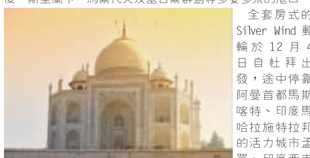
泰姬陵於17世紀由蒙兀兒第五代君主沙賈汗興建，象徵他對妻子至死不渝的愛。

豪華郵輪公司Silversea Cruises將於12月推出由杜拜出發前往馬埃島的16天異國風情之旅，途中造訪阿曼、印度、斯里蘭卡、馬爾代夫及塞舌爾群島等多姿多采的港口。