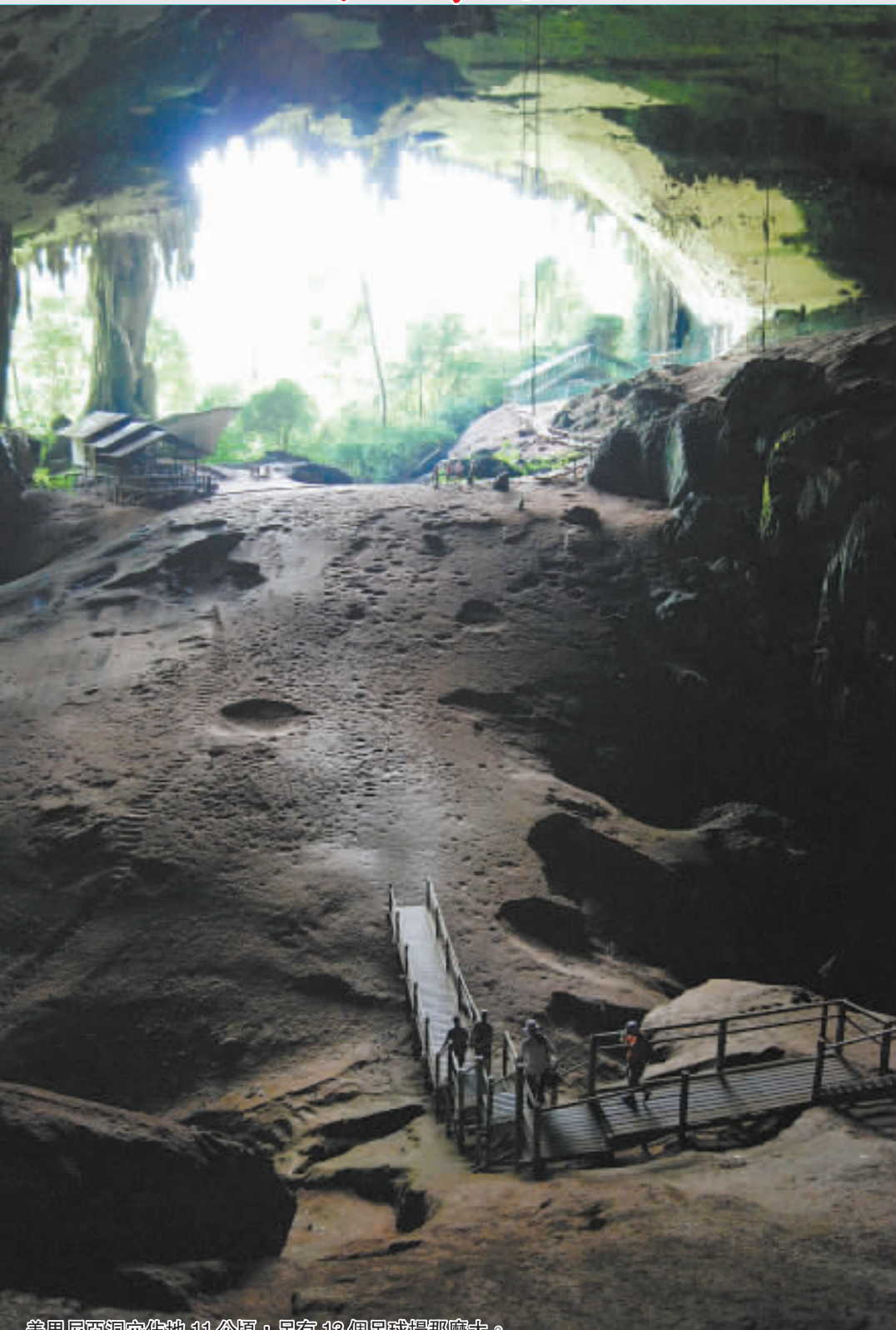
美里尼亞洞穴佔地11公頃，足有13個足球場那麼大。