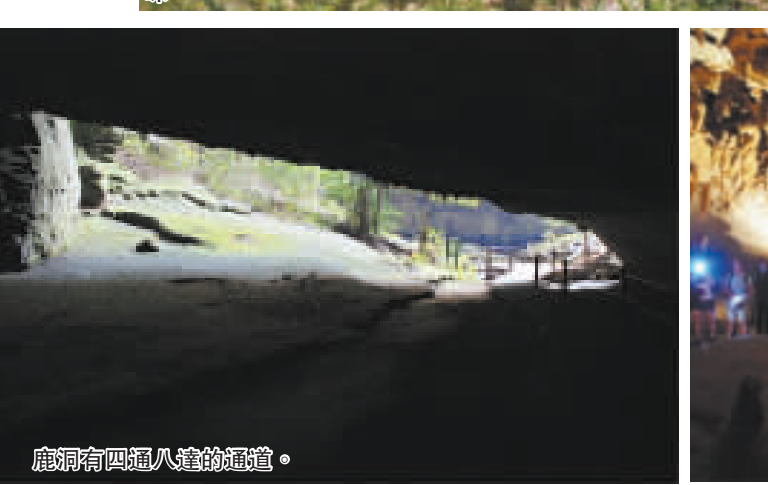
鹿洞有四通八達的通道。

最佳的行程安排，莫如入住山上的Borneo Highlands Resort 兩天，除了打球之外，亦品嚐這裏的全素宴，再享受山中的Spa。Borneo Highlands Resort 置身深山，是真正的大自然風味。