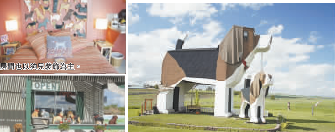
房間也以狗兒裝飾為主。

位於美國的愛達荷州，有一對超巨型木製獵犬，號稱為全球最大，而且造型趣緻，叫人忍不住走近一看——原來這不止是裝飾品，還是可以入住的旅館，是名副其實的「狗屋」，名為Dog Bark Park Inn，《倫敦時報》還將此處列為20大最有趣入住地點，有機會實在是非入住不可。這對巨型獵犬分別名為Willy和Toby，不過只得體型較大的Willy可以入住。Willy