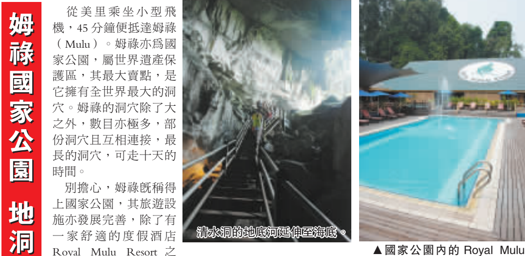
姆祿國家公園地洞探險

從美里乘坐小型飛機，45分鐘便抵達姆祿（Mulu）。姆祿亦為國家公園，屬世界遺產保護區，其最大賣點，是它擁有全世界最大的洞穴。姆祿的洞穴除了大之外，數目亦極多，部份洞穴且互相連接，最長的洞穴，可走十天的時間。別擔心，姆祿既稱得上國家公園，其旅遊設施亦發展完善，除了有一家舒適的度假酒店Royal Mulu Resort之外，四個開放給一般遊客的洞穴——鷹洞、鹿洞、清水洞及風洞，均有基本照明系統及木板鋪成的小路，遊覽相當方便及容易。