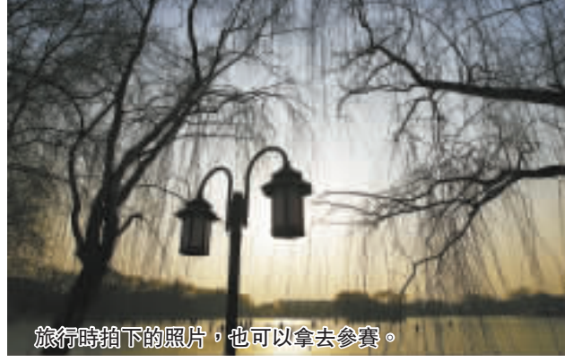
旅行時拍下的照片，也可以拿去參賽。