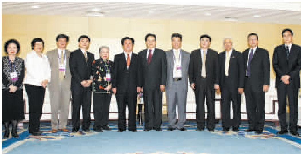
河南省委書記徐光春(右六)昨日會見全球商報經濟論壇部分嘉賓。

【商報鄭州專訊】特派採訪組報道：河南省委書記徐光春昨日會見全球商報經濟論壇嘉賓時表示，論壇選擇在豫舉辦，是「選準地方恰逢其時」。徐表示，現時河南正在實施文化與經濟建設兩大跨越，全球商報聯盟年會和經濟論壇在河南召開，無疑對河南實施兩大跨越，促進河南大發展起到重要作用。而年會選擇在金融危機後的經濟剛剛復蘇時舉辦，這對河南進一步探討和研究應對金融危機，戰勝危機，走出危機都有幫助，的確是選準了地方，亦恰逢其時。