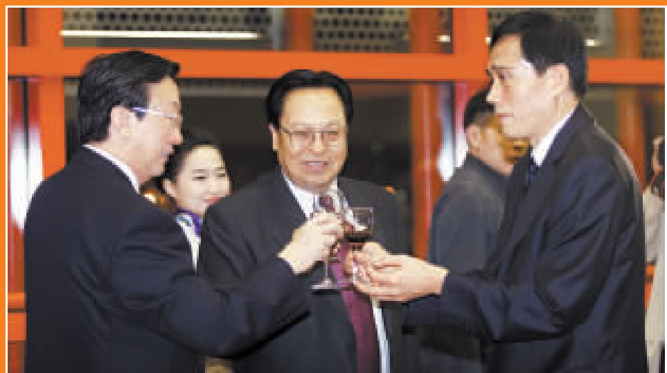
昨夜的鄭州流光溢彩、魅力四射。河南省人民政府「2009全球商報經濟論壇」歡迎晚宴在鄭州國際會展中心觀景長廊隆重舉行。來自五大洲30多個國家和地區的500多名嘉賓及河南政要、各界名流參加了晚宴。河南省委常委、宣傳部長孔玉芳笑稱：此次晚宴是河南舉辦的規格最高、規模最大、人數最多的晚宴之一。左側兩圖為晚宴現場盛況，上圖為徐光春(中)、郭庚茂(左)與黃揚略互相敬酒。