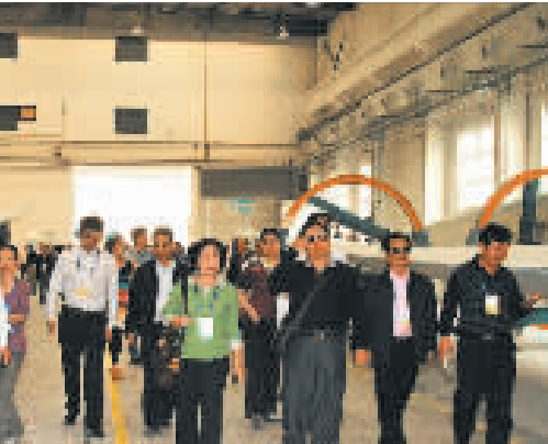
香港客商在洛陽一家風電公司考察。