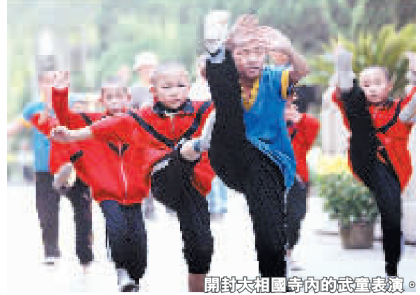
開封大相國寺內的武臺表演。