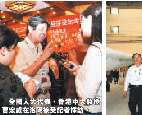
全國人大代表、香港中大教授曹宏威在洛陽接受記者採訪。