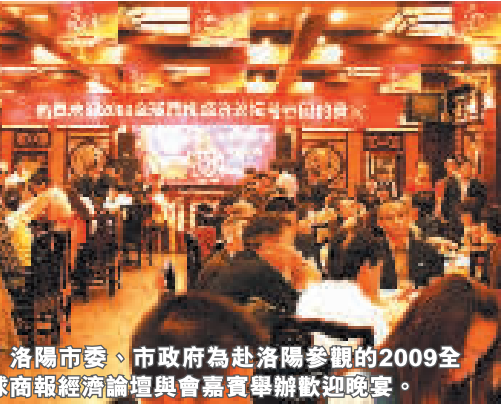
洛陽市委、市政府為赴洛陽參觀的2009全球商報經濟論壇與會嘉賓舉辦歡迎晚宴。