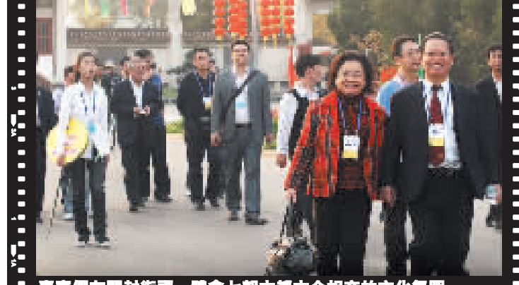
嘉賓們在開封街頭，體會七朝古都古今相交的文化氛圍。

【商報開封專訊】特派採訪組報道：參加2009全球商報經濟論壇的部分嘉賓昨日赴河南省開封市考察參觀。此行適逢開封菊花展，七朝古都到處燈籠結綵，秋菊飄香。嘉賓們一行踏訪開封府衙、參觀宋文化主題公園——清明上河園，遊覽龍亭、大相國寺等知名旅遊勝地，觀看《大宋·東京夢華》背景演出等，深刻地感受了開封的宋朝文化與現代文明的巧妙結合。同時，開封也向遠道而來的客人展示了自己改革開放的嶄新面貌，樹立了「只開不封」的外部形象，這個充滿生機與活力、正在迅速崛起的城市讓嘉賓們驚歎不已。