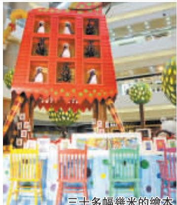
三十多幅幾米的繪本

日期：即日起至 12 月 26 日（露天廣場）、 即日起至明年 1 月 5 日（二樓大堂） 時間：上午十時至下午十時