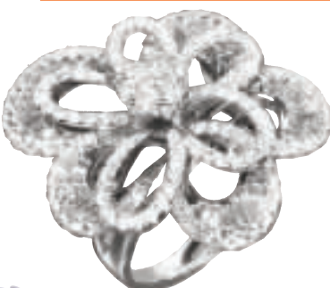
◀這枚花型的鑽石戒指，中間一粒較大的鑽石加上閃石點綴，售$14580 攤位 G6，8 H5、7。