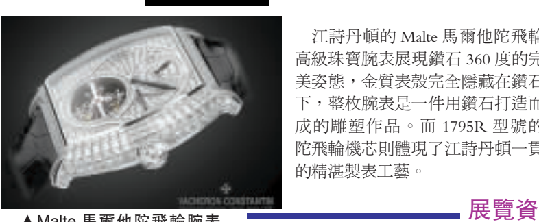
▲Malte 馬爾他陀飛輪腕錶透過其藍寶石水晶玻璃表底蓋，整個機芯可一覽無餘。

日期：11月29日至12月9日 時間：上午十時至晚上八時 地點：尖沙咀1881商場江詩丹頓旗艦店