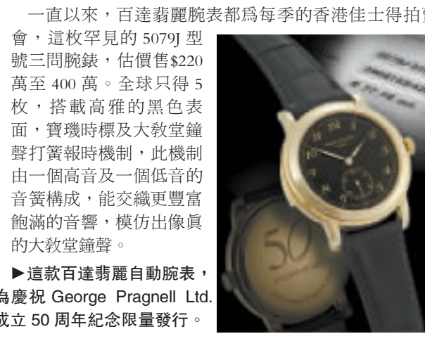
▶這枚百達翡麗自動腕錶，為慶祝 George Pragnell Ltd. 成立50周年紀念限量發行。

今次拍賣會將提供超過450枚極為罕有，當中包括多個超級品牌作品，如愛彼、寶璣、卡地亞、百達翡麗、勞力士、雅典及江詩丹頓等，總值逾6000萬港元，為大家提供不同口味及價格的選擇。 這次拍賣會其中一個亮點是朗格的鉑金、陀飛輪、自動上鏈、雙追針計時碼表 (Tourbograph「Pour le Mrite」)，限量生產51枚，估價約售$220萬至400萬。它結集三大複雜製表功能，包括芝麻鍊傳動系統、陀飛輪及雙秒追針計時功能。時至今日，這枚腕錶仍然是品牌旗下最複雜的款式，因為它由人手製作的L903.0自動上鏈機芯，由超過1000塊獨立部件組成，陀飛輪本身擁有84塊部件，重量不足0.5克，光是打磨修飾搭橋的程序便需時兩天。 一直以來，百達翡麗腕錶都為每季的香港佳士得拍賣會，這枚罕見的5079J型號三問腕錶，估價$220萬至400萬。全球只得5枚，搭載高雅的黑色表面，寶璣時標及大教堂鐘聲打簧報時機制，此機制由一個高音及一個低音的音簧構成，能交織更豐富飽滿的音響，模仿出像真的大教堂鐘聲。