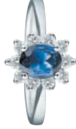
◀這枚18K白金的戒指，用鑽石襯托藍寶石，售$1880，女士們必定喜歡，攤位L2、4、6 G1、3、5。