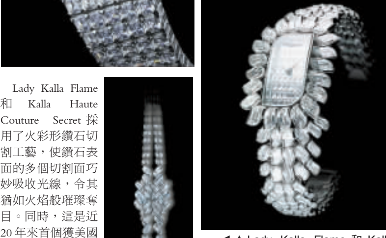
◀Lady Kalla Flame 和 Kalla Haute Couture Secret 採用了火彩形鑽石切割工藝，使鑽石表面的多個切割面巧妙吸收光線，令其猶如火焰般璀璨奪目。同時，這是近20年來首個獲美國寶石學會官方認可的鑽石切割技術，高尚的你又怎可放過。

江詩丹頓的 Kallania 全鑽腕錶以186顆祖母綠形鑽石製成，總重170克拉，而這款腕錶配置了世界上最纖薄的1003型號機械機芯，將傳統的精湛工藝與現代設計結合起來，這是江詩丹頓標誌性的藝術傑作之一，愛美的你一定會喜歡。 ◀Kallania 全鑽腕錶上每粒寶石的形狀都如一個倒金字塔，令其更加璀璨奪目，煥發出絢爛光澤。