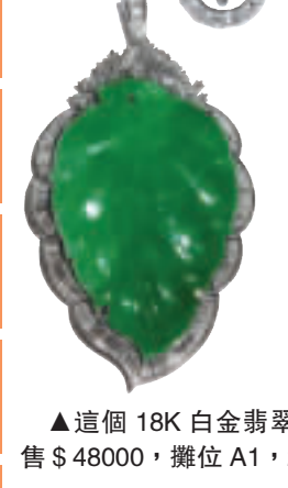
▲這個18K白金翡翠吊墜，售$48000，攤位A1、2。