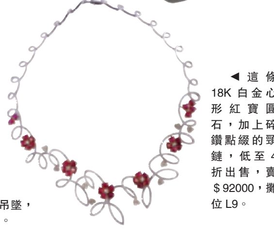
◀這條18K白金心形紅寶圓石，加上碎鑽點綴的頸鏈，低至4折出售，實$92000，攤位L9。