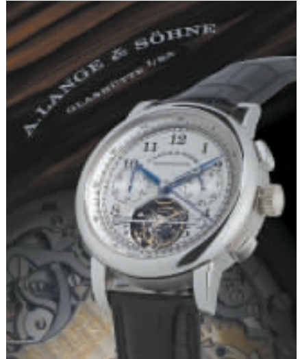
▲這款明格雙追針計時碼表，於2006年製，陀飛輪，自動上鏈，限量生產51枚。

拍賣會資料 地點：香港會議展覽中心 預展日期：今日至12月1日 時間：上午十時至下午六時 拍賣日資料 珠寶拍賣日：12月1日 時間：下午3時 名表拍賣：12月2日 時間：上午十一時及下午二時三十分