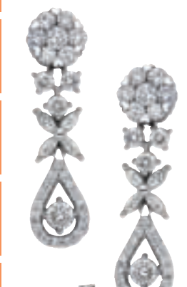
◀這對鑽石耳環設計優雅，售$13880，攤位E19、21。