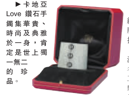
▶卡地亞 Love 鑽石手鐲集華貴、時尚及典雅於一身，肯定是世上獨一無二的珍品。

拍賣佳士得，將於12月1日在香港會議展覽中心舉行「瑰麗珠寶及翡翠首飾」秋季拍賣會，拍賣超過250件總值高達2.6億港元的珠寶。今次拍賣會將會展示一系列稀世的鑽石及彩鑽、珍貴寶石和頂級品質的翡翠，當然還有一眾名家的設計作品如 Bulgari、Cartier、Graff、Van Cleef & Arpels 等，供大家選擇。