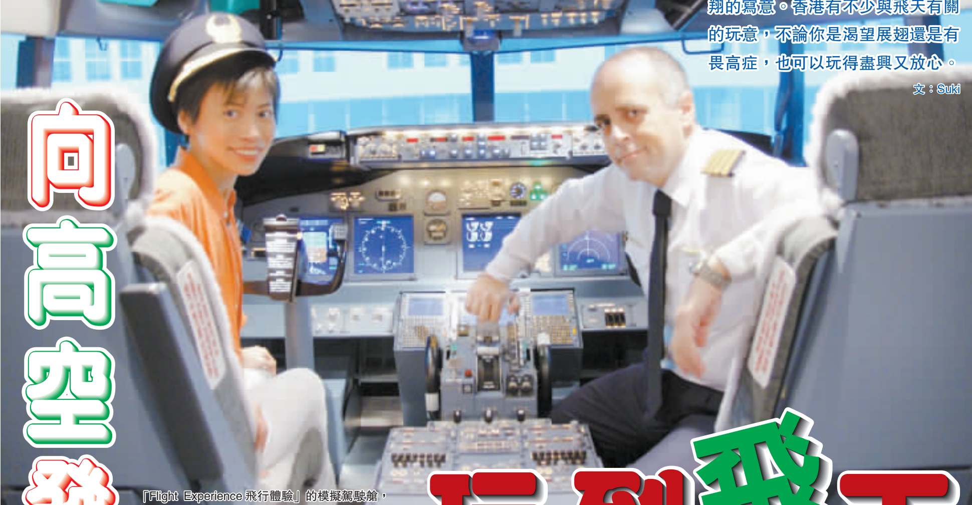
「Flight Experience 飛行體驗」的模擬駕駛艙，擁有真實飛機駕駛艙的儀器。