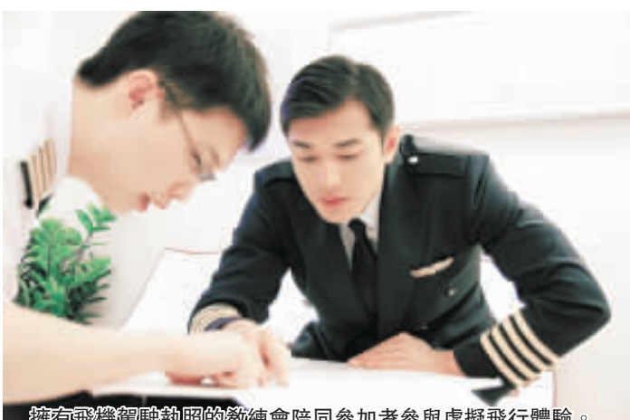
擁有飛機駕駛執照的教練會陪同參加者參與虛擬飛行體驗。

實感操控訓練，像真程度與真實駕駛無異。為迎接聖誕來臨，「Flight Experience 飛行體驗」亦推出一系列聖誕飛行套餐，讓參加者在節日氣氛濃厚的芬蘭天空上翱翔天際，在漫天飛花下直飛聖誕老人村，或在赤鱗角機場一面駕駛一面欣賞虛擬雪景。