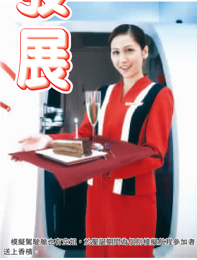
模擬駕駛艙也有空姐，於聖誕期間為個別模擬航程參加者送上香檳。