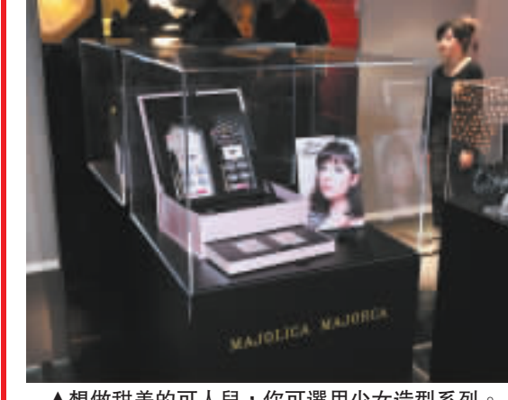
▲想做甜美的可人兒，你可選用少女造型系列。

絕版化妝品展出 不少日系美少女追捧的化妝品品牌 MAJOLICA MAJORCA，不知不覺已登陸屈臣氏一周年，為此品牌特別從日本空運10套絕版的化妝精品到港，並於京華中心內的旗艦店展出，讓全港粉絲有機會近距離欣賞到其經典人氣產品。 另外，品牌最近推出的魔幻彩妝系列中，亦有4款主打造型同場示範，分別是Cool（冷艷）、Sweet（甜美）、Elegant（高貴）及Dolly（娃娃造型）。有興趣的你也親身感受，只要由即日起至12月4日來臨銅鑼灣京華中心屈臣氏便可。 日期：即日起至12月4日 地點：銅鑼灣京華中心屈臣氏