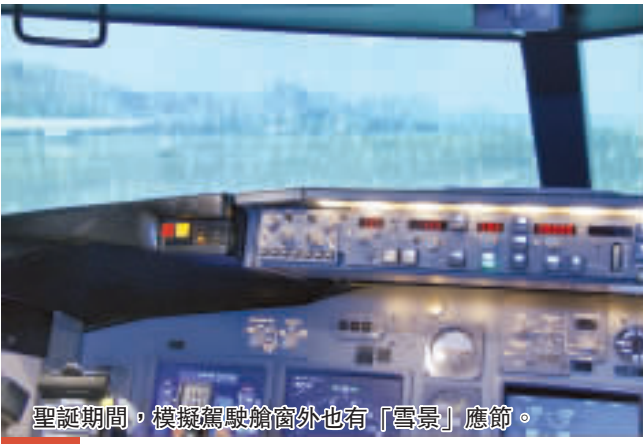
聖誕期間，模擬駕駛艙窗外也有「雪景」應節。

報上常有旅遊家坐熱氣球環遊世界的外國新聞，若要一試直飛天空的逍遙感覺，只要去海洋公園便行了，因為那兒有一個斥資一千萬元購入的氦氣球，可以同時接載29人升空。氣球約高34米，直徑22米，氣球充氣後達6000立方米，遊客可以站在載客籃，看陸地逐漸遠縮，從360度全方位欣賞南區風景。