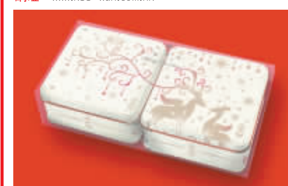
▲今年奇華餅家推出兩款的聖誕禮盒，均售$58。

奇華餅家推聖誕禮盒 聖誕節快將來臨，最溫馨當然是為愛親朋送上一份精心挑選的聖誕禮物。今年奇華餅家推出一套兩款的聖誕禮盒，其中包括各兩款的曲奇及糖果，而兩款均以方形鐵盒盛載，盒面是一幅充滿冬日情懷的圖畫，上面布滿漫天星星、雪花和一隻雪鹿，構圖極富浪漫聖誕色彩。 盒內盛載的曲奇及糖果，包括鬆脆美味的朱古力粒香橙味曲奇及朱古力粒朱古力曲奇；甜蜜滋味的手製烏結糖及椰絲花生軟糖。禮盒於12月4日起於全線奇華餅家分店發售。 網址：www.kee-wah.com.hk