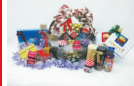
▲吉之島的網上聖誕禮物籃專賣區，有逾100款聖誕貨品給你布置獨一無二的聖誕禮物籃。

JUSCO 網上聖誕禮物籃 聖誕節快臨，今年JUSCO網上購物城為大家準備了聖誕禮物籃專賣區，你可以在網上自選逾100款精選之聖誕貨品，包括朱古力糖果、聖誕蛋糕、英式茶、特式咖啡、日式禮盒、各式精選聖誕食品、雜貨及酒類等，都可由你配搭，亦可以按自己的預算而選購價錢合理的禮品，可以靈活自主地揀選合心意的禮物籃給摯愛的親朋戚友。 另外，J CARD會員於網上購物滿$390，可享有聖誕禮物籃免費送貨服務，而非J CARD會員於網上購物滿$490亦可享有免費的送貨服務。 訂購日期：即日起至12月25日 最後送貨日期：2010年1月1日 網址：www.juscocityhk.com