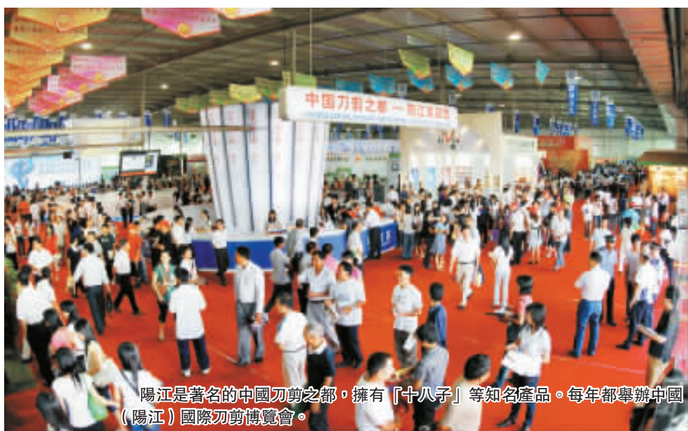
陽江是著名的中國刀剪之都，擁有「十八子」等知名產品。每年都舉辦中國（陽江）國際刀剪博覽會。

陽江市位於廣東省西南沿海，全市總面積 7946.4 平方公里，人口 273.3 萬。現轄江城區、陽東縣、陽西縣，代管陽春市。設海陵島經濟開發試驗區、陽江高新技術產業開發區。