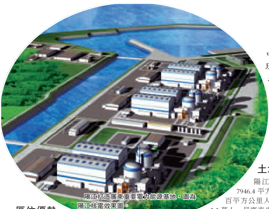
陽江打造廣東重要電力能源基地。圖為陽江核電效果圖。