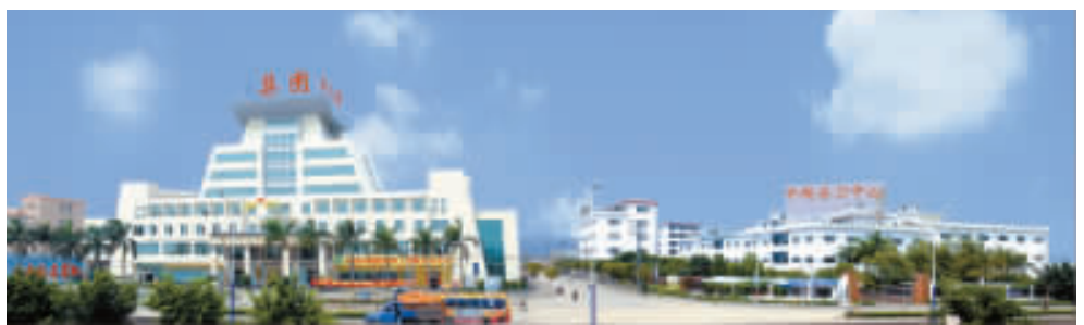
陽東形成了特色鮮明的五金刀剪產業集群，將建設五金刀剪產業示範園。

據悉，陽東將根據轉移行業的產業鏈延長及行業特點，重新定位、調整規劃產業轉移園區。將在佛山禪城（陽東萬象）產業轉移工業園規劃建設五金刀剪產業示範園，同時規劃建