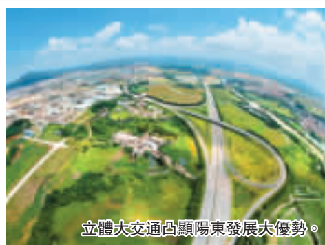
立體大交通凸顯陽東發展大優勢。

陽東縣位於廣東省西南沿海，珠江三角洲西緣，是粵西連接珠三角地區的東大門。近年來，陽東縣積極創造條件，主動接受珠三角輻射帶動，大力建設產業轉移園區，打造工業強縣，培育出五金刀剪等一批強勢產業。2009 年實現工業總產值 177.94 億元，增長 19.1%。在政府科學統籌、協調督促、宏觀引領全縣經濟發展的形勢下，陽東 2010 年將全力謀求發展新突破，加快建設「經濟強縣、和諧陽東、宜居新城」，力求實現「三年大變化，十年大跨越」的宏偉目標。