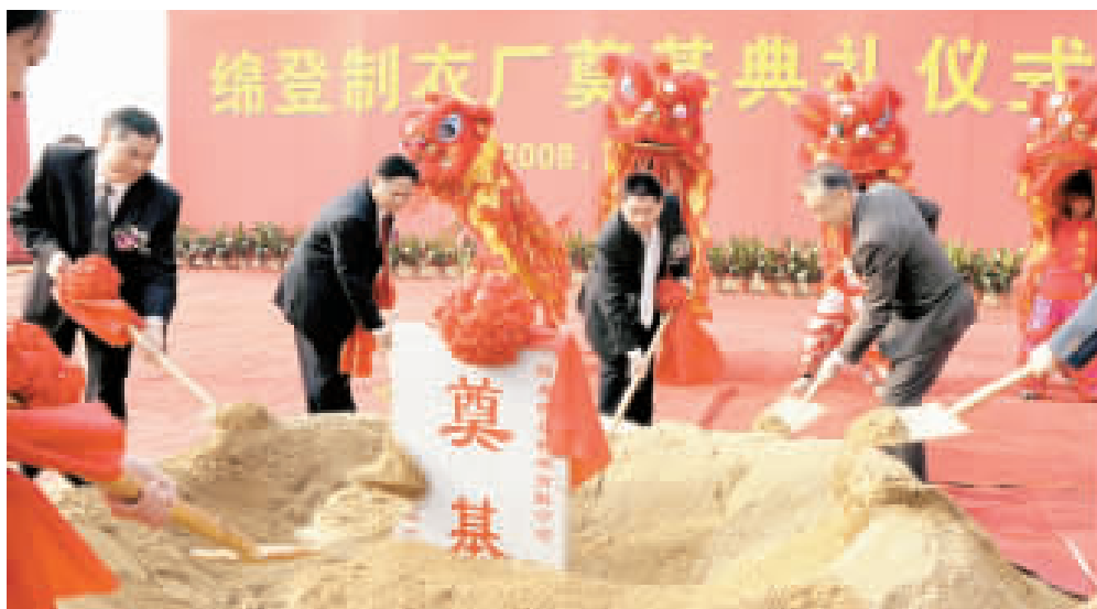
陽春一大批投資項目開工或投產。