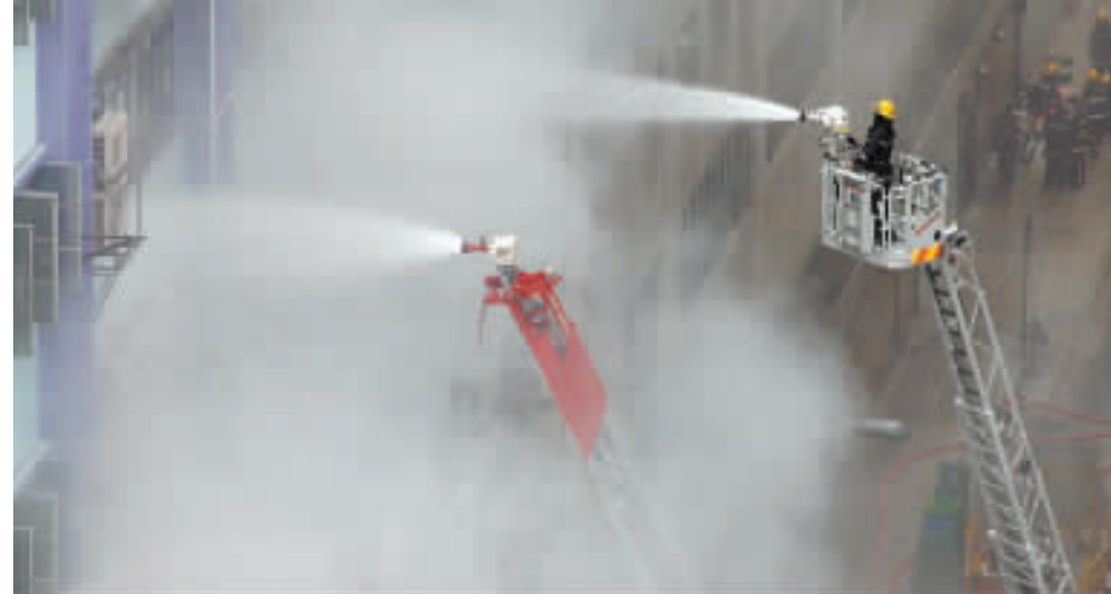
長沙灣麗昌工業大廈4級火警，消防員努力撲救。