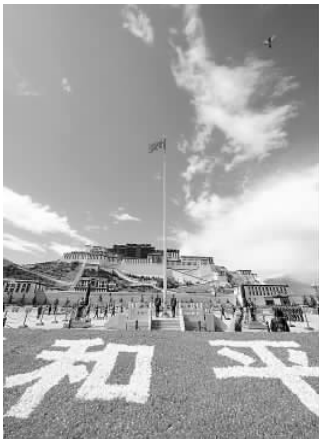
西藏和平解放60周年。