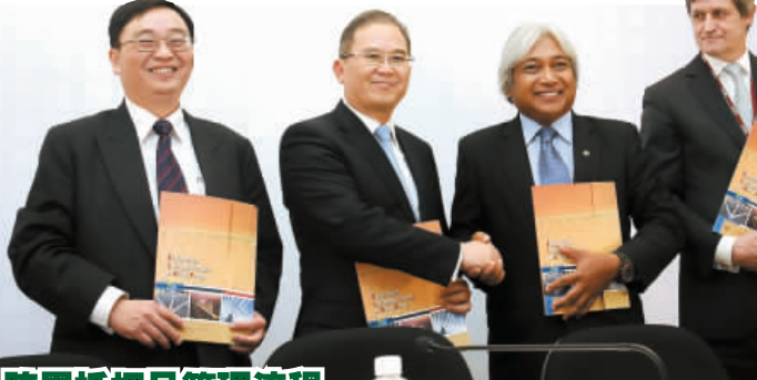
昨日的跨境債券平台發布會上，(左起)香港金管局助理總裁李建英、金管局副總裁彭麗棠、大馬國家銀行署理總裁莫哈末依布拉欣、歐洲清算銀行董事總經理兼業務發展主管安索尼合影。