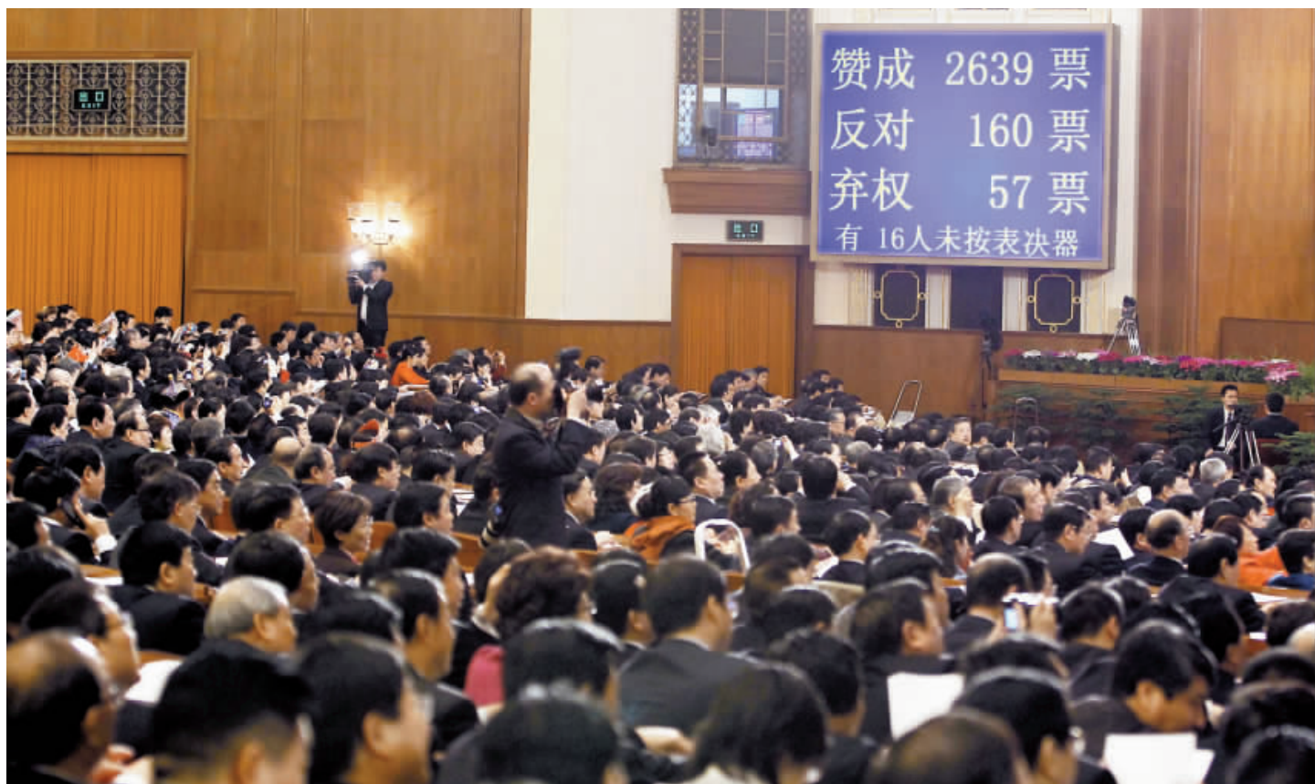
十二屆全國人大五次會議在完成各項議程後，昨日上午在人民大會堂閉幕。「刑訴法修正案」以高票獲得通過。