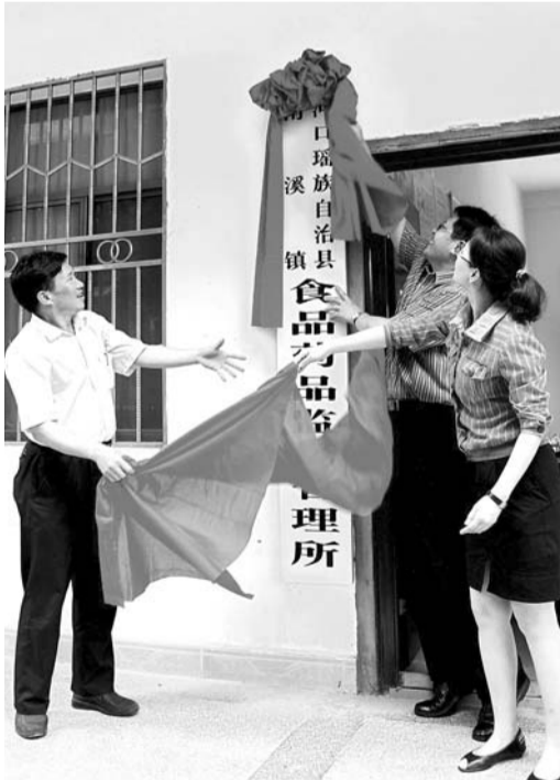
雲南省第一家鄉鎮食品藥品監督管理機構掛牌

「我們要抓住『橋頭堡』建設的歷史機遇，把握住紅河州在『橋頭堡』建設中發揮重要作用這個關鍵點，讓全州食品藥品監管事業科學發展、和諧發展、跨越發展。」