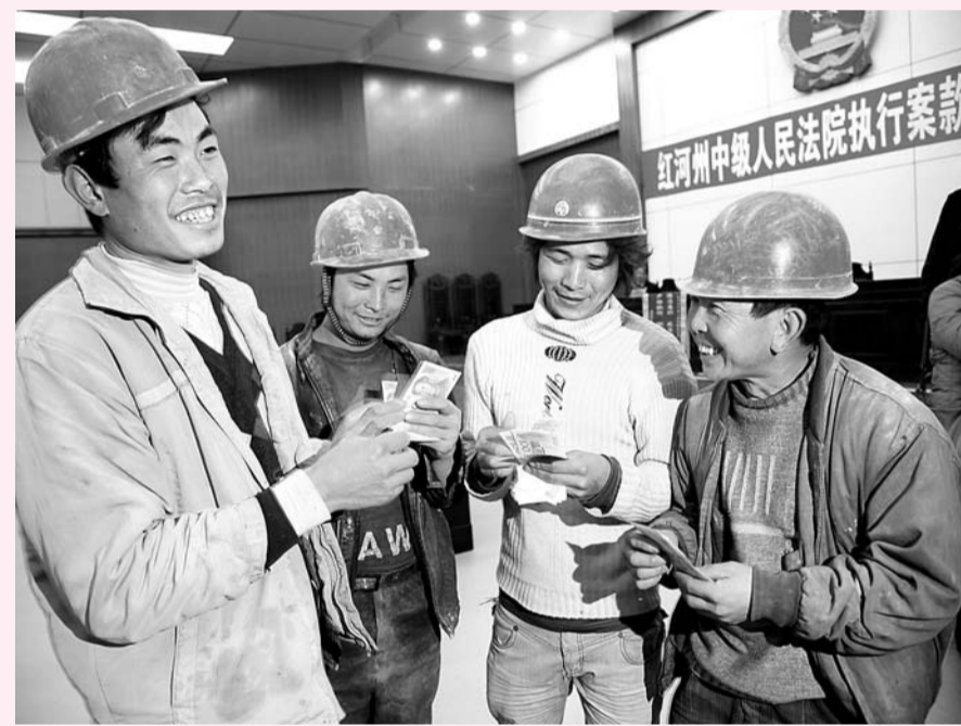
為農民工提供法律援助討回薪資

通過幾年來的努力，目前，紅河州每個縣市擁有一個法治文化廣場、一個法治網站、一份法治刊物、一個法治電視節目；每個鄉鎮有一條法治文化街、一間法律書屋；每個村（社區）有一個法律圖書角、一個普法宣傳欄；全州共有67個社區達到「民主法治社區」標準，其中有4個省級「民主法治社區」；有921個村委會達到「民主法治村」要求，有4個全國「民主法治村」和30個省級「民主法治村」。