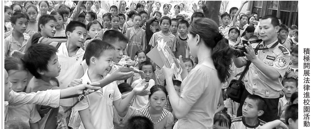
積極開展法律進校園活動

目前，紅河州共建立基層人民調解委員會1535個28841人，廣泛滲透到各鄉鎮、村民委員會、街道（社區）、企事業單位和社會團體。所轄13縣市均已組建交通事故民事損害賠償、醫患糾紛等人民調解委員會和工作室。