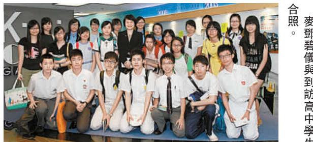
麥碧儀與到訪高中學生合照。

市民大眾日常生活相關的最新研發成果。生產力局總裁麥碧儀早前迎來全新「生產力展館」的首批訪客——25名來自多家中學的高中生，與他們共度生產力之旅。她表示：「經過40多年的發展，香港工業由昔日的傳統家庭式作業提升到現在的高科技及高增值生產模式，生產力局一直與時並進，協助企業增強競爭力，當中不少工作更直接改善了市民的生活質素。」