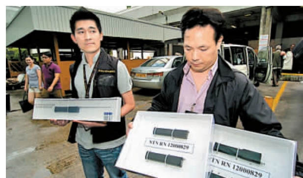
警員展示起獲的五支電槍。

被捕2名男子(30歲及60歲)被帶返警署扣留調查，至昨午3時許，探員將其中一名60歲疑犯押返其大埔廣福邨廣惠樓寓所搜查，並無檢獲其他違法物品，涉案男子當時態度囂