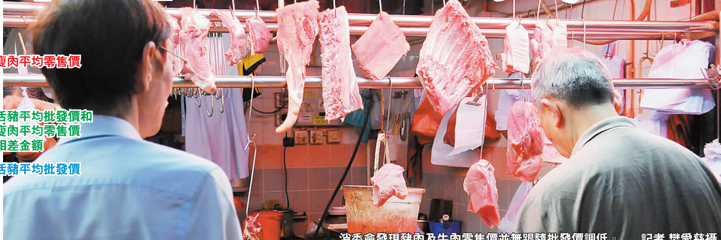
消委會發現豬肉及牛肉零售價並無跟隨批發價調低。