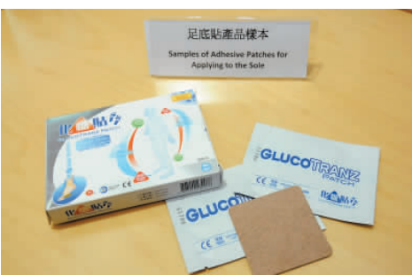
消委會質疑一款聲稱可化血糖足底貼功效。

該足底貼產品「化糖貼」聲稱曾於北京和天津通過臨床研究，並獲得中國藥監局發出的京藥監械(準)字證書，但調查發現，此藥除了違反內地標識管理規定之外，更數次因廣告內容嚴重欺騙、誤導消費者被國家藥監局曝光。本港衛生署證實該產品表列證書已於去年失效，續期申請亦同時被拒絕。消委會收到的投訴指，病人初用時感覺良好，但其後再買一批使用時，足部出現變紅、脫皮和痕癢。醫院藥劑師學會質疑，該產品藥理、效果不明確，臨床證據亦無法獲得認可。由於糖尿病患者足部感覺會減弱甚至喪失感覺，不當使用有可能形成壓力致使皮膚及軟組織潰瘍，因此不建議消費者在未有醫護人員指導下使用該產品。如果會使用該產品，應接受醫生檢查，以便及時發現及預防足部皮膚問題。香港醫學學會會長蔡堅指出，糖尿病是慢性病，可令人體神經系統、生殖器官等受損，若使用無效藥貼治療可導致殘障甚至死亡等嚴重後果。