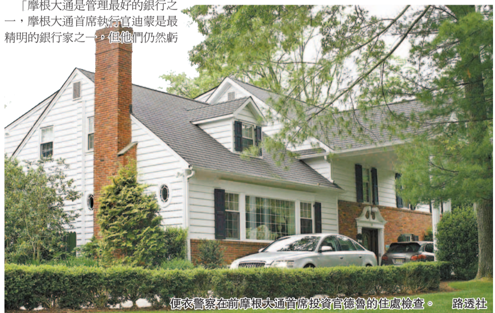
便衣警察在前摩根大通首席投資官德魯的住處檢查。

奧巴馬說，該銀行犯下的一系列錯誤表明，政府必須要改革治理華爾街的政策。他並稱：「目前我們還不知道交易的所有細節，還需要進一步調查，但這就是我們推動華爾街改革的初衷。」