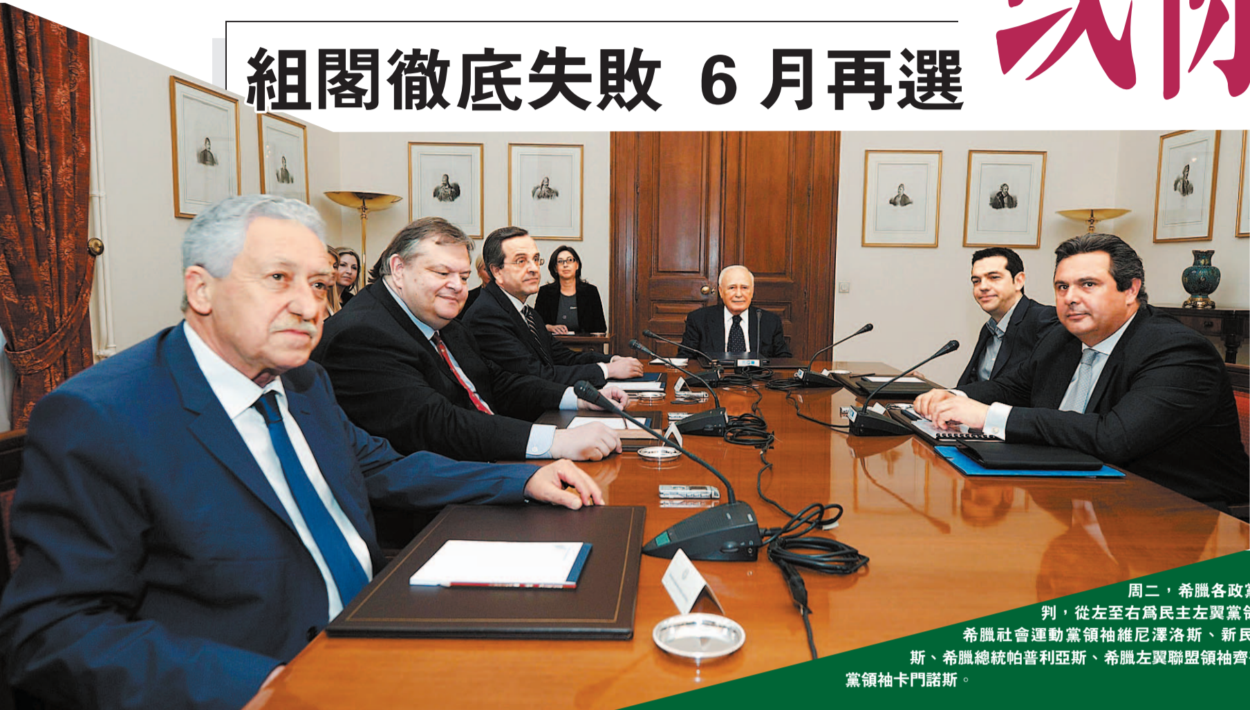
周二，希臘各政黨領導人進行組閣談判，從左至右為民主左翼黨領導人科維里斯、泛希臘社會運動黨領袖維尼澤洛斯、新民主黨領袖薩馬拉斯、希臘總統帕普利亞斯、希臘左翼聯盟領袖齊普拉斯和獨立希臘人黨領袖卡門諾斯。

歐央行和EBA儘管支持這一協議，不過仍警告稱，這可能會向國家監管者讓渡太多權力，從而破壞歐盟的整體監管規則。歐央行副行長康斯坦西奧表示：「可能存在風險。」