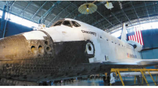
穿梭機「發現號」已光榮退役，靜躺在維吉尼亞州博物館內。

他又指，發現號機身上共有2.3萬多塊耐高溫的磁磚，每一塊磁磚都有自己的序號，「因每一塊磁磚