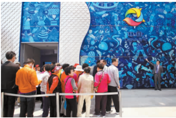
韓國麗水世博中國館外等候入場的人龍。

【香港商報訊】上周六剛開幕的韓國麗水世博會因參觀人數遠遠低於預期，只達到當初預測的10%，令主辦單位感到憂慮。據悉，麗水世博會組織委員會當初預測，世博