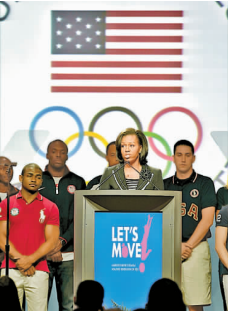
美國第一夫人米歇爾抵達會場為奧運代表團打氣。

【香港商報訊】由泳壇巨星菲爾普斯、體壇公主柳金等一眾體壇巨星領銜的美國奧運代表團，在達拉斯媒體峰會上接受公眾的首次檢閱，更令他們興奮的是美國第一夫人米歇爾14日抵達會場為代表團打氣，並鼓勵美國青少年在奧運選手的激勵下參與體育運動。