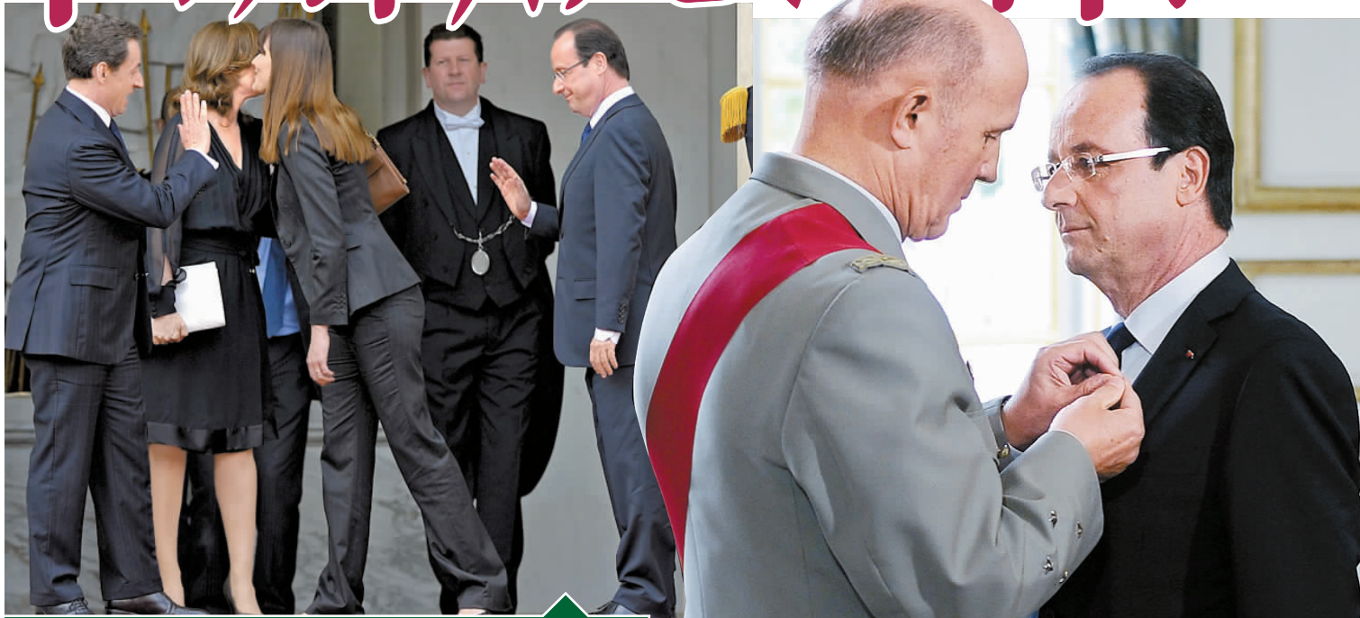
在愛麗舍宮外，奧朗德向薩科齊揮手道別，總統女友與前第一夫人則相擁而別。

不過，中國現代國際關係研究院歐洲所副所長張健認為，歐盟各國都希望歐元區和歐盟能生存下去，因此，各國仍應繼續分岐，尋找解決辦法，這也是奧朗德剛正式接任總統就訪問德國的原因，歐盟包括法、德兩個大國難以承受危機失控的嚴重後果。歐盟終究會以自己的方式渡過危機。