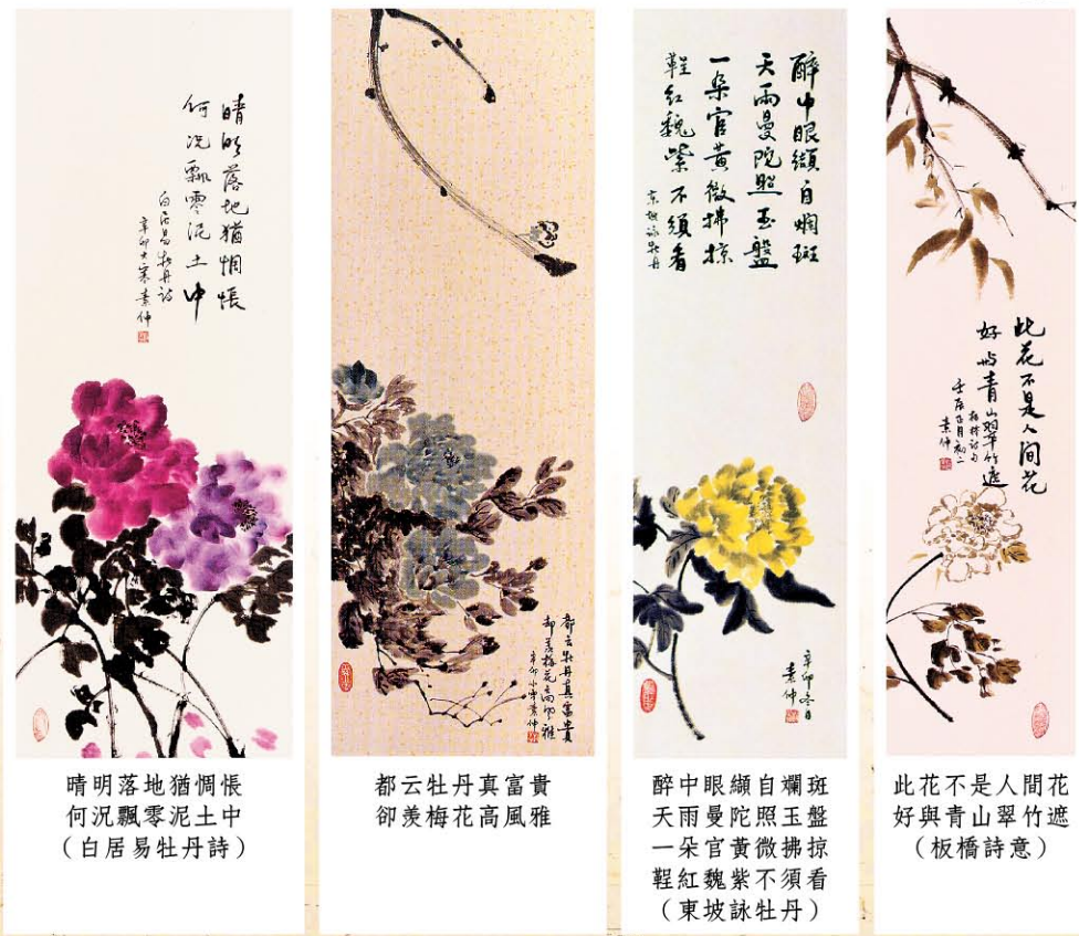
晴明落地猶惆悵 何況飄零泥土中 (白居易牡丹詩)