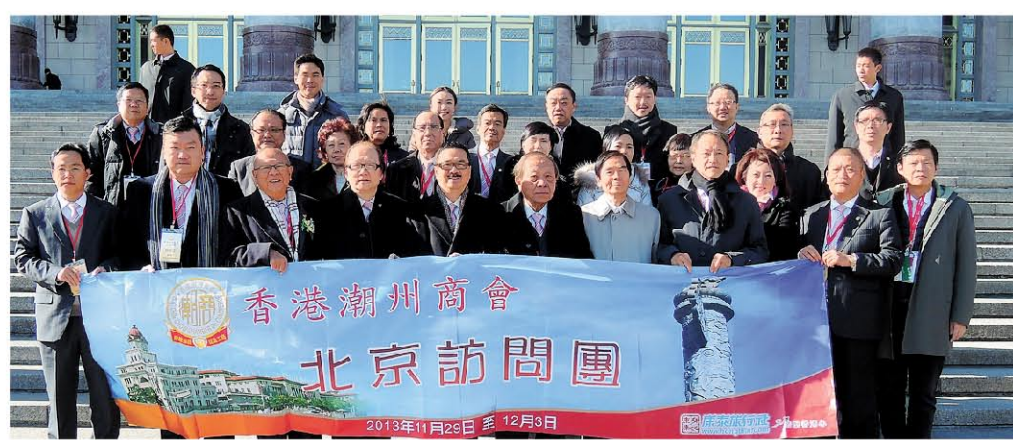
訪問團成員在北京人民大會堂前合照。

訪京團先後受到國務委員楊潔篪、國僑辦主任袁媛平、中央統戰部副部長林智敏、國務院港澳辦副主任周波等領導的熱情接待，並肯定香港潮州商會滿懷愛國愛港熱情，多年來廣泛團結潮籍鄉親，維護香港繁榮穩定，加強香港與內地聯繫等方面作出積極貢獻。冀望該會再