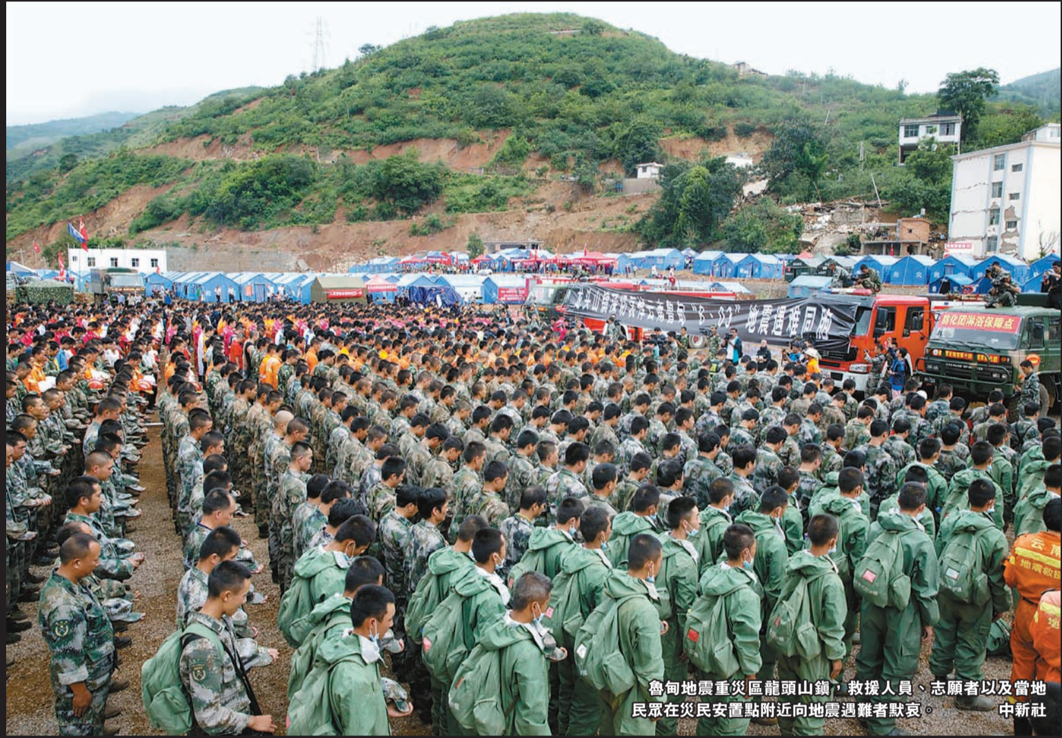
魯甸地震重災區龍頭山鎮，救援人員、志願者以及當地民眾在災民安置點附近向地震遇難者默哀。

雲南省民政廳表示，災區對遇難人員遺體運送開闢綠色通道，在取得遇難者家屬同意的基礎上，通過火化、土葬等方式對遇難者遺體進行處置，截至9日19時，災區遇難人員善後事宜已得到妥善處理。