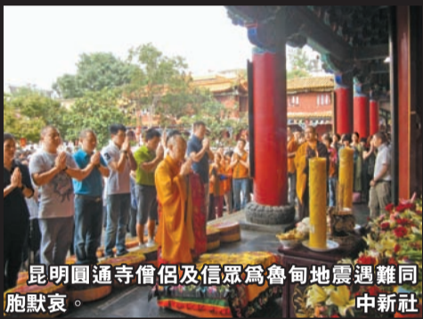
昆明圓通寺僧侶及信眾為魯甸地震遇難同胞默哀。