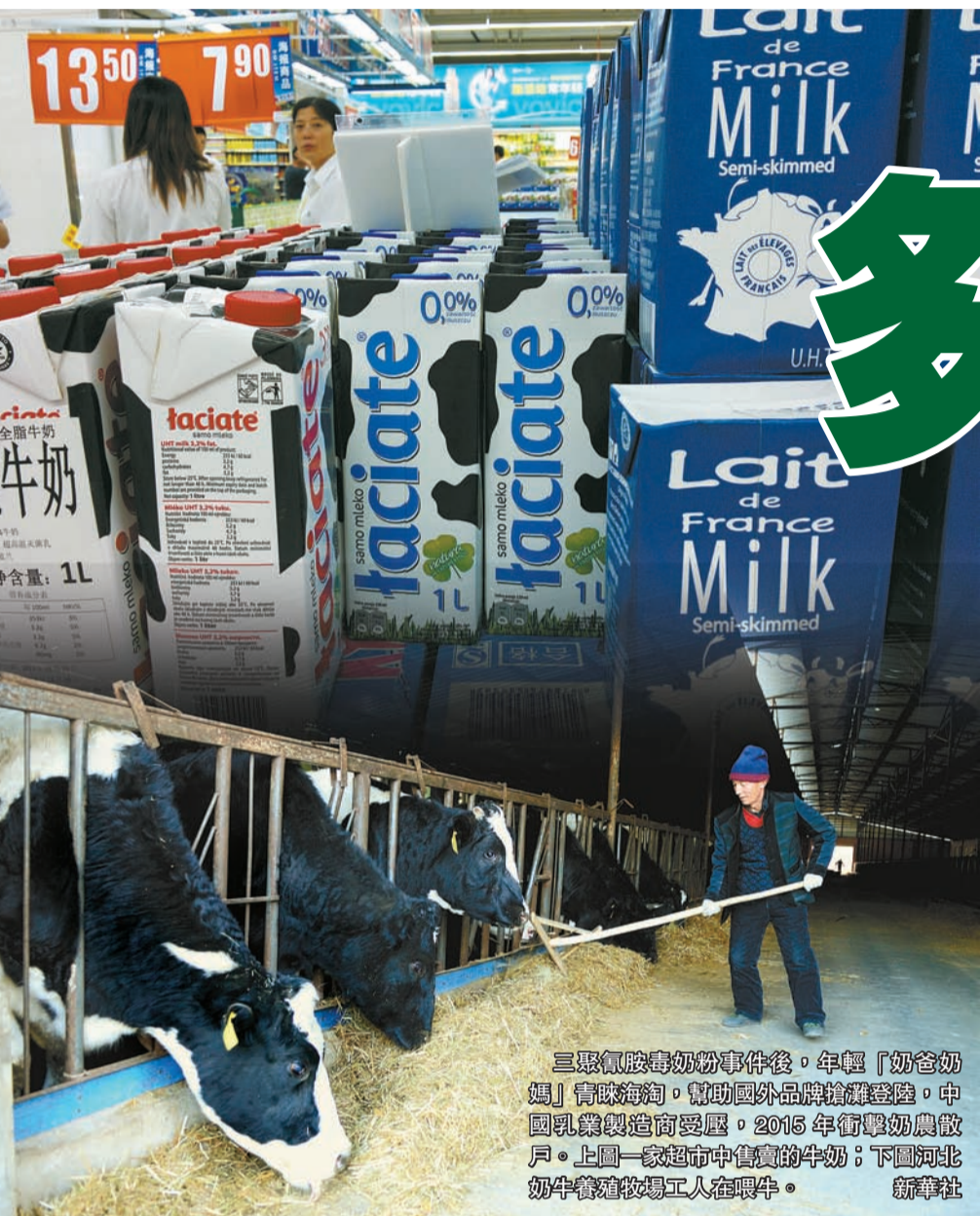
三聚氰胺毒奶粉事件後，年輕「奶爸奶媽」青睞海淘，幫助國外品牌牌牌聲望。中國乳業製造商受壓，2015年衝擊奶農散戶。上圖：一家超市中賣賣的牛奶；下圖：河北奶牛養殖場工人在喂牛。

「在加工和消費方面，要切實採取措施引導乳企多用生奶來生產鮮牛奶，減少復原奶的使用，引導消費者飲用鮮牛奶。此外，要推動實施乳業生產領域的保險和托底政策，在奶價大幅降低時確保奶農利益有最低保障。」廣東省奶業協會名譽會長關偉昆說。