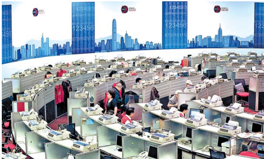
港股昨休市，而中港基金互認利好下，A股再成脫韁野馬，滬綜指連破4700點及4800點兩個關口。