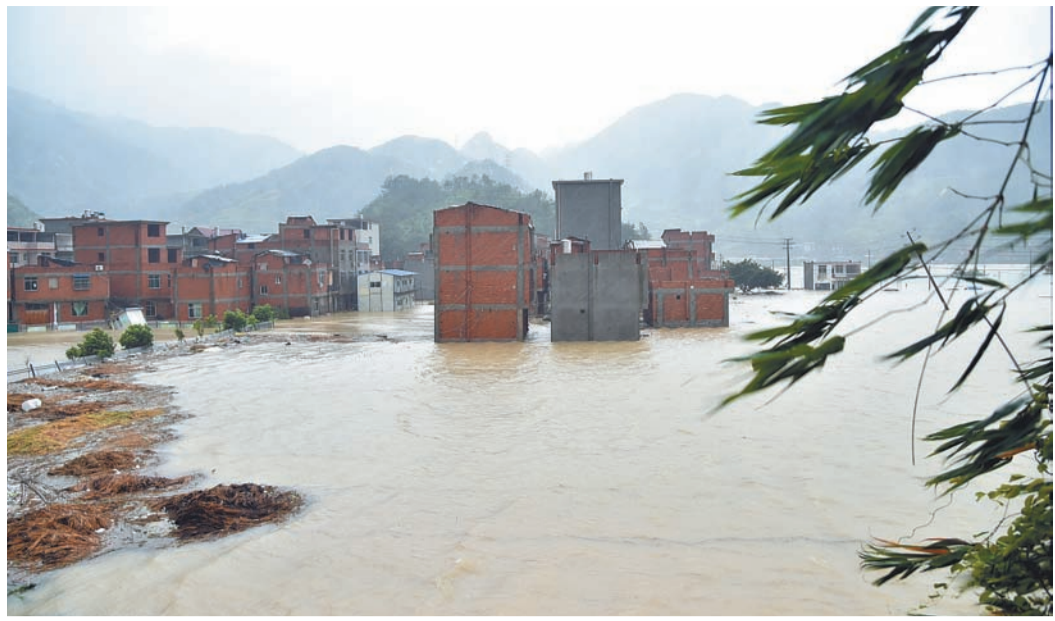
8月9日在福建寧德市蕉城區三都鎮城里村拍攝的水情。

國家減災委、民政部昨日針對颶風蘇迪羅及其殘留雲系給福建、浙江兩省受災群眾基本生活造成的嚴重影響緊急啓動國家IV級救災應急響應，派出兩個工作組趕赴災區查看災情。