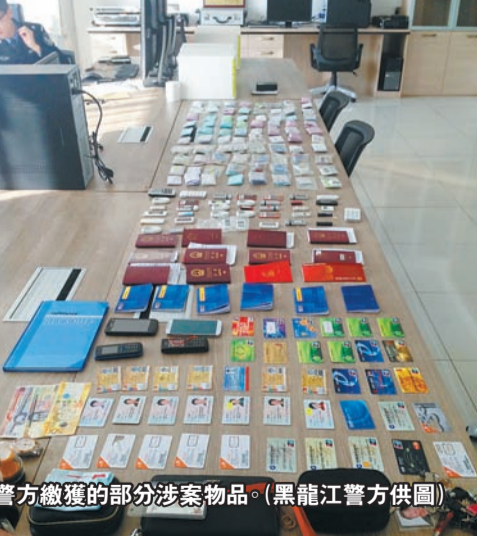
警方繳獲的部分涉案物品。