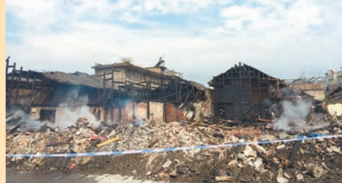
部分老建築被大火燒毀成廢墟。