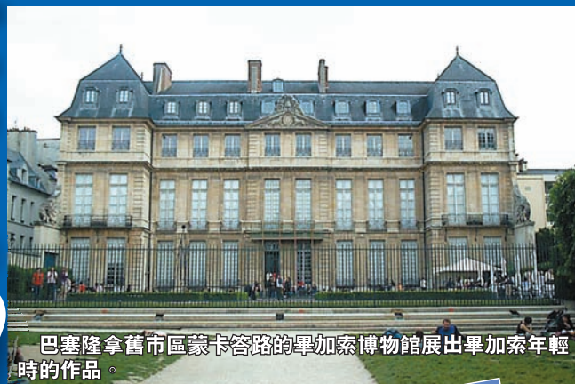
巴塞隆拿舊市區蒙卡答路的畢加索博物館展出畢加索年輕時的作品。