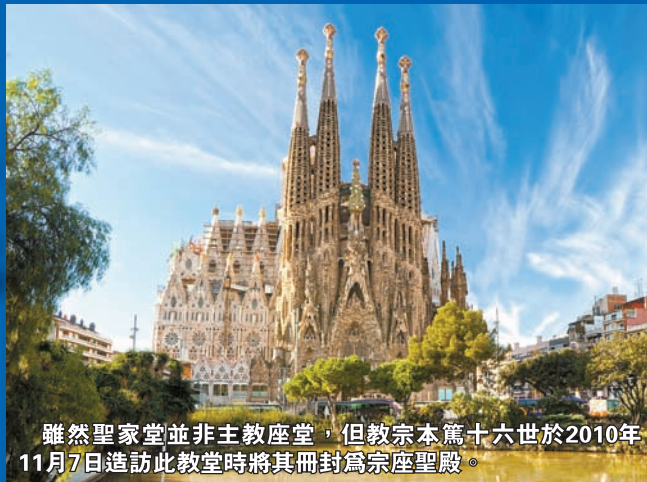
雖然聖家堂並非主教座堂，但教宗本篤十六世於2010年11月7日造訪此教堂時將其冊封為宗座聖殿。

Ronda隆達為西班牙最早發展鬥牛文化所在地。而Plaza de Toros則有兩百多年歷史，為西班牙境內最古老的鬥牛場。