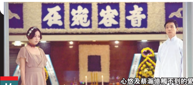
心悠及蔡瀚億觸不到的愛！