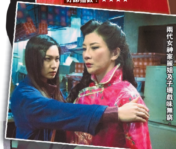
兩代女神家麗姐及子珊戲味無窮。

雖然「撞鬼」人人都怕，但「撞鬼」這類題材的電影，卻人人都喜歡追看，特別是由女神主演的，更是越驚越要看！