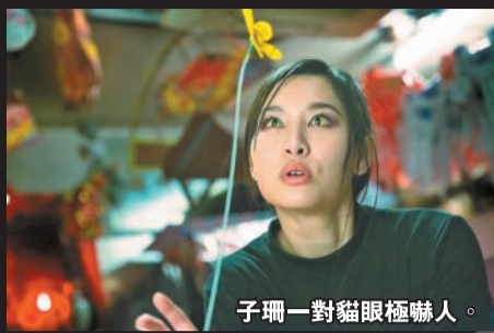
子珊一對貓眼極嚇人。