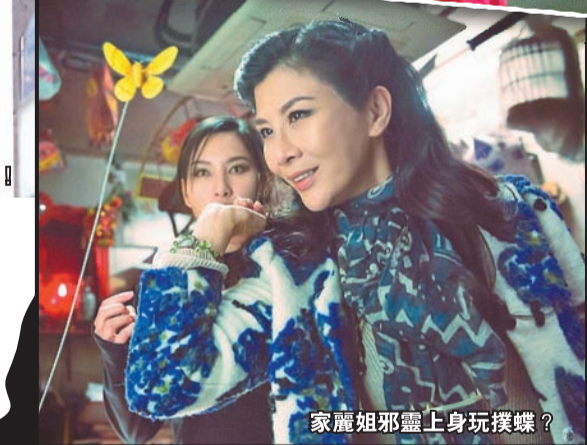
家麗姐邪靈上身玩撲蝶？