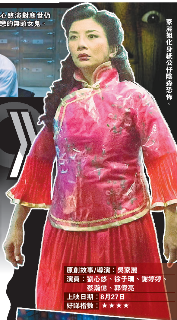
家麗姐化身紙公仔陰森恐怖。