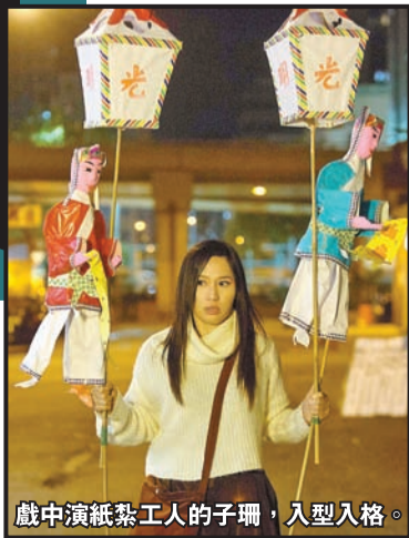
戲中演紙紮工人的子珊，入型入格。