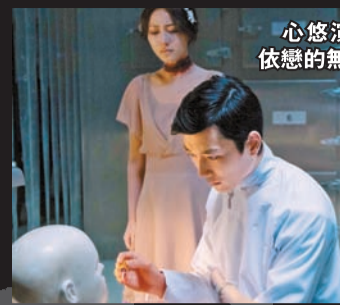
心悠演對塵世仍依戀的無頭女鬼。