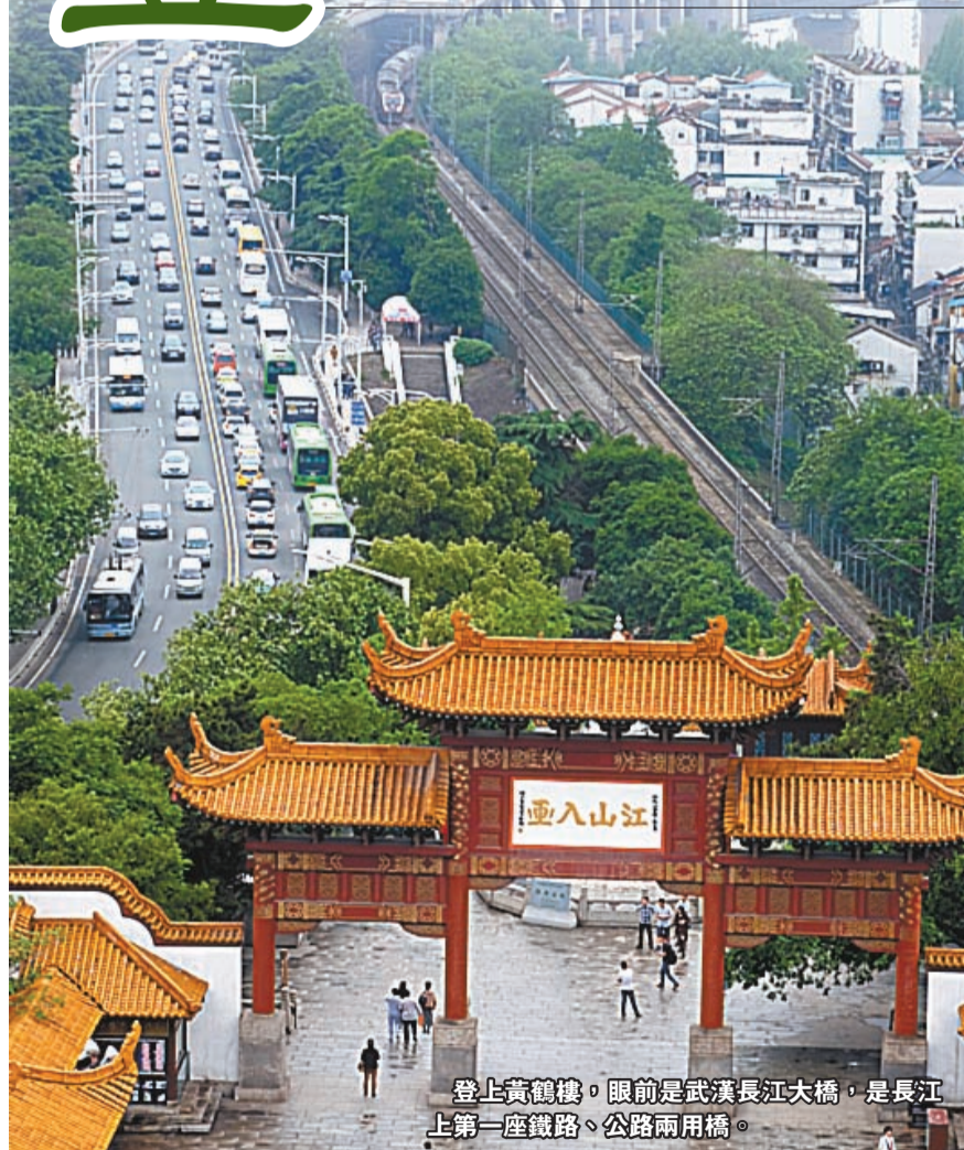
登上黃鶴樓，眼前是武漢長江大橋，是長江上第一座鐵路、公路兩用橋。