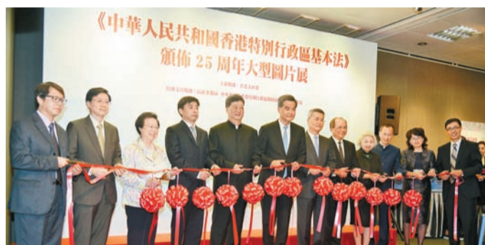
CY(左六)與嘉賓主持基本法圖片展剪綵儀式。