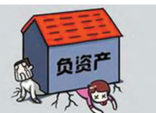
相信未來負資產個案會增加。