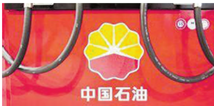
中石油分拆管網業務有進展。

中石油集團發布報告稱，中國油氣儲運領域將按照網運分開的既定思路，逐步推動管道業務分離分立，在條件成熟的情況下成立獨立的管網公司。中國石油經濟技術研究院副院長表示，2016年石油天然氣體制改革總體方案即將出台，油氣行業覆蓋全產業鏈的「立體改革」將全面展開，改革將向進一步打破行政壟斷、管住自然壟斷、放開競爭環節的方向推進。各項改革將在試點基礎上逐步推進，實施細則和配套政策的制訂將是2016年的重頭戲。中石油今年在分拆管網業務將有重大進展，留意當中交易能否提升業務盈利能力及估值。