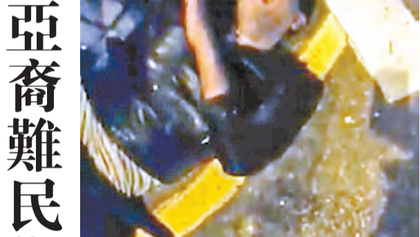
涉案南亞裔男子哭着求饒。網上圖片

【香港商報訊】記者萬家成報道：尖沙咀昨日凌晨發生街頭搶劫案。一名女子在麼地地道街頭相約女友，接過對方用白紙包好的5.8萬元現金後離去途中，被獨行南亞裔賊人上前將錢搶走。女事主窮追期間，驚動10名見義勇為途人協助，將賊人制服交給警方，賊人事後雖然哭着求饒：「I am sorry！」惟眾人均不為所動。