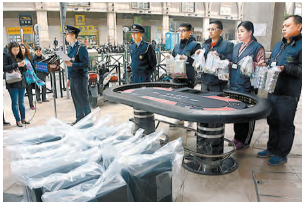
澳門首次發現有人豪宅內經營非法賭場，圖為治安警察局在現場舉行記者會。

過往警方查獲的非法賭博案件，都在單位、地舖或在街中聚賭打麻雀，玩十五胡及牌九等，注碼通常很