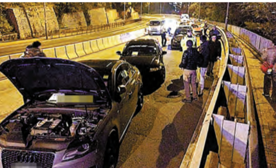
警方截獲多輛非法改裝私家車。

【香港商報訊】記者馮仁樂報道：交通警與飛車黨大門法！前晚在香港仔「飛車熱點」展開部署打擊非法賽車，以「布袋戰術」成功攔截6輛「辣車」，拘捕15名涉案男女扣查；並揭發有人拆車牌以防「影快相」。