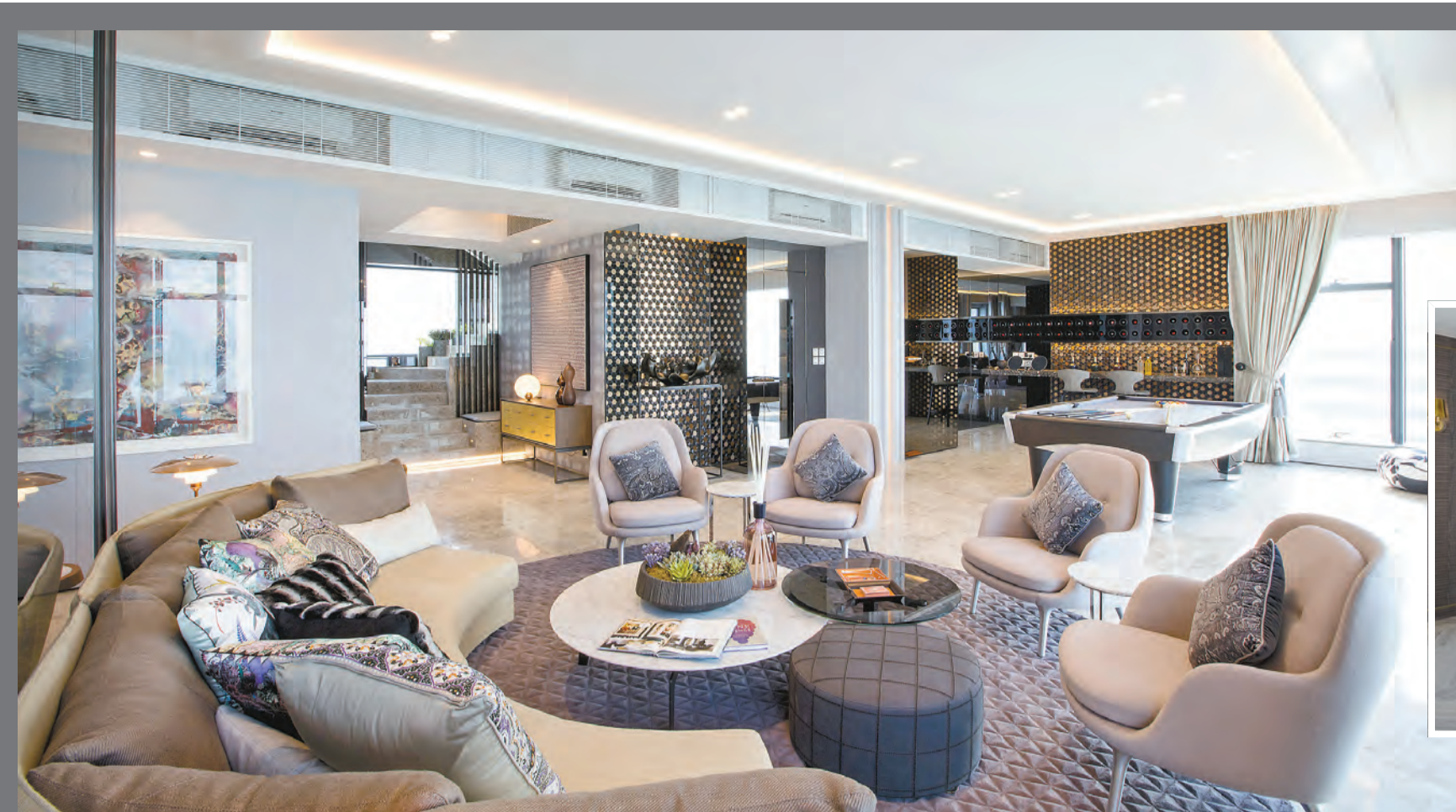
現樓複式示範戶 38 及 39 樓 A 室，實用面積 3518 平方呎，大廳面積達 1100 平方呎，空間感強烈。

香港居住環境密集，要擁有一間景觀遼闊的住宅已經不容易，若然住所視野開揚之餘兼位處商業核心區，且內裏有數千平方呎生活空間，那該是大部分港人夢寐以求的理想居停。這裏介紹的維港峰複式戶，便是這種夢幻式住宅。