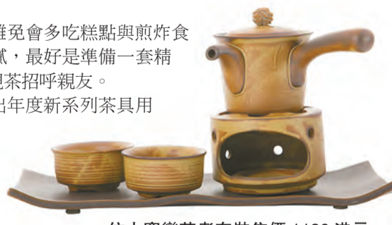
仿古窯變茶煮套裝售價 1180 港元。