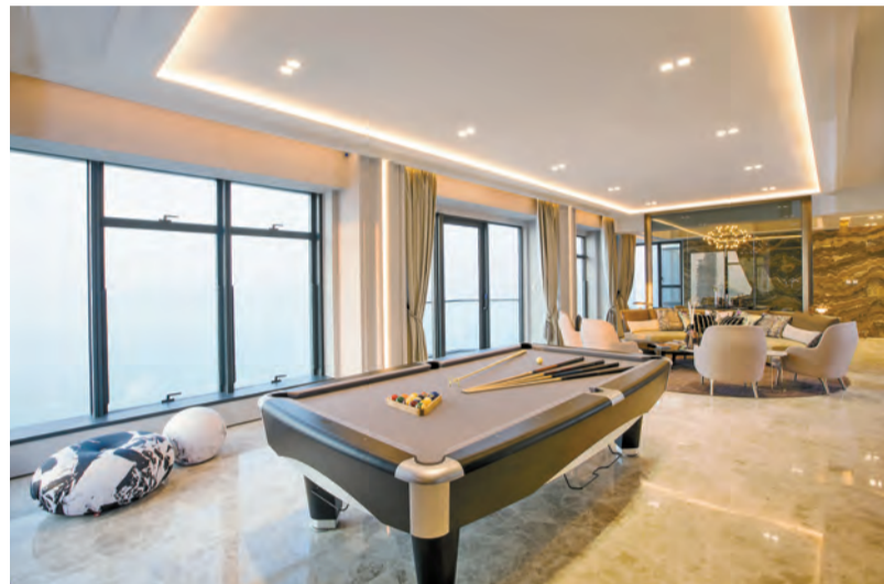
能夠像示範戶 38 及 39 樓 A 室般，在家中擺放桌球檯，是不少桌球迷的夢想。

維港峰位於干諾道西與嘉安街交界，位處港鐵香港大學站與西營盤站之間，步行往港大站 B1 出口約 5 分鐘，不過由該出入口前往站內列車處亦需 5 至 10 分鐘；至於前往西營盤站則約 10 分鐘路程，附近亦有電車、巴士及小巴行走，交通方便。項目所在的港島西區發展成熟，德輔道西一帶設有各式商舖及食肆，而且鄰近中、上環核心商業區，佔盡地利，有望吸引年輕才俊。