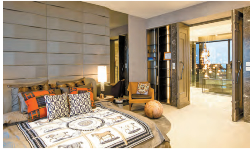
複式示範戶 A 室另一間套房用上雙子房門，一派大宅風範。