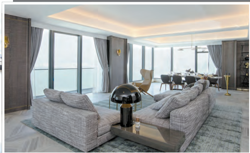
現樓示範戶 38 及 39 樓複式 B 室，實用面積 3443 平方呎，大廳飽覽無際維港景色。