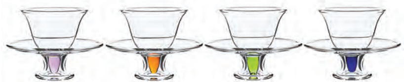
色彩鮮艷的時尚小彩杯，每隻連杯托售 170 港元。