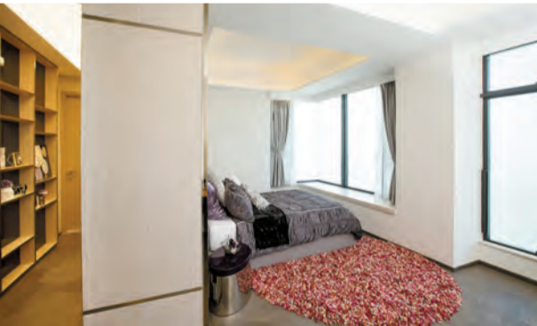
複式示範戶 B 室另一間睡房設有步入式衣帽間。

由英皇發展的維港峰，位於港島干諾道西 180 號，為一座樓高 35 層的住宅項目，提供 125 個單位。項目已屆現樓，標準樓層單位實用呎價約 22000 港元起。