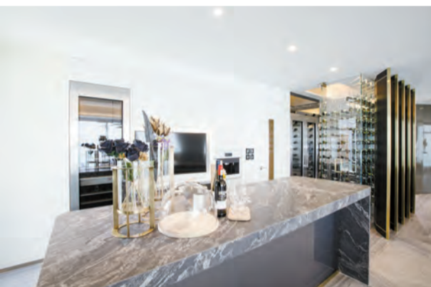
38 及 39 樓複式 B 室的大廳一隅設有品酒間，旁為步入式藏酒區。