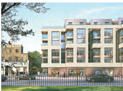
Camberwell on the Green 樓高 6 層，提供 92 個單位。

物業坐落倫敦東南部，該區現正進行重建計劃，附近的公園帶來優美景色，另外亦有遊樂區、體育設施等配套，具投資潛力。該地段鄰近 Overground 地鐵站，可由該站搭乘地鐵前往倫敦主要的 Victoria 和 Clapham Junction 車站，輕鬆連接倫敦市中心、West End、倫敦市內和國際火車站。