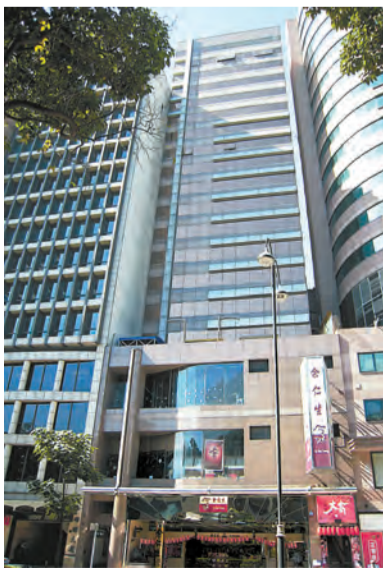
余仁生中心位於尖沙咀核心地段，位置優越。

物業由美聯代理，位於漆咸道南 11 至 15 號余仁生中心中層，全層面積約 1978 平方呎，以 1978 萬元放售，呎價 10000 元。單位同時放租，每月租金約 69200 元，呎租約 35 元。上述單位間隔四正實用，景觀開揚，可飽覽維港景致，工作環境理想。余仁生中心距離尖東港鐵站僅數步之遙，亦鄰近交通交匯處，設有多個巴士站，來往各區皆十分方便。大廈並毗鄰大型商場 K11，各類商店、食肆一應俱全，配套齊全。