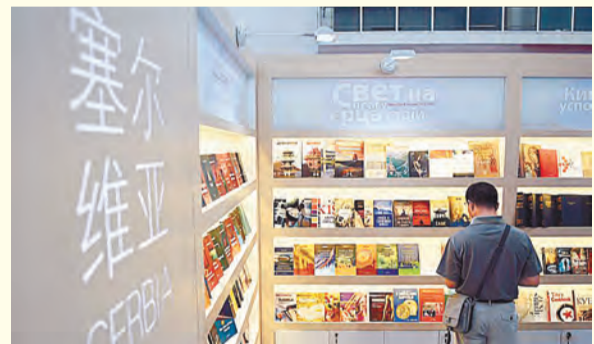
觀展者在塞爾維亞展區閱覽。

第23屆北京國際圖書博覽會24日拉開帷幕。86個國家和地區的2400多家中外出版商參展，展示圖書30餘萬種。中東歐16國作爲本屆圖博會的聯合主賓國，攜其出版業在書展上進行大規模亮相。 喜愛中東歐文學的人們對於波蘭著名作家亨利克·顯克維奇都十分熟悉。他的著作《十字軍騎士》曾被翻譯成中文在中國出版，深受中國讀者喜愛。24日，這部著作的中文有聲讀物在北京圖博會上與中國讀者們見面。除了《十字軍騎士》，一大批中東歐國家的優秀文學作品也在本屆圖博會上亮相。比如，波蘭展向中國讀者推薦的《華沙的戰後建築》，塞爾維亞展台推薦的《學習斯拉夫語》，《俄羅斯之窗》等出版物，也吸引了不少中國讀者和出版界人士駐足。 21世紀初期，來自中東歐作家的長篇小說、詩歌、散文等文學作品就已經進入到中國讀者的視野。諸如捷克作品《好兵帥客》、波蘭作品《你往何處去》等一大批中東歐優秀作品在中國翻譯出版，深受中國讀者的喜愛。