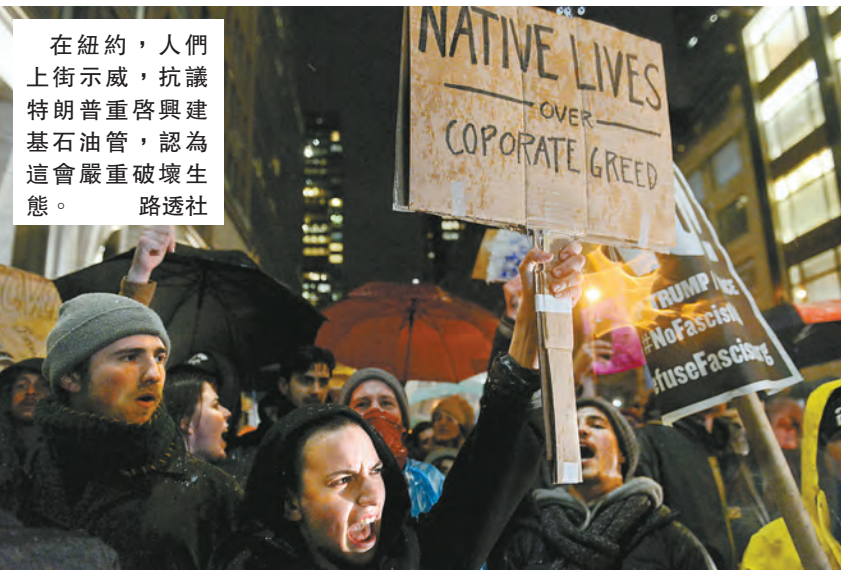
在紐約，人們上街示威，抗議特朗普重啓興建基石石油管，認為這會嚴重破壞生態。

【香港商報訊】特朗普周二簽署行政命令，重啓備受爭議的基石XL輸油管道項目和達科他管道項目。