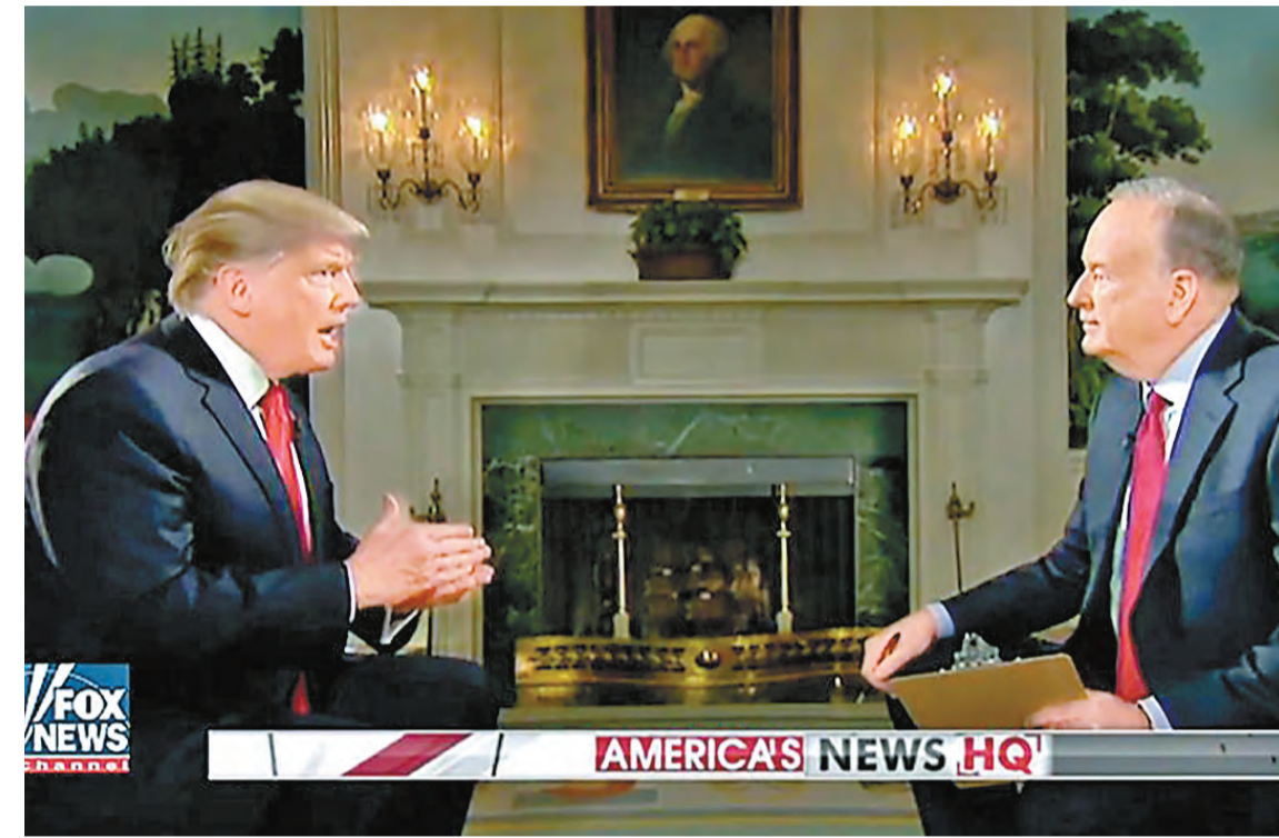
特朗普接受霍士新聞主播奧雷利的採訪時，為「普京是劊子手」一說護航。

【香港商報訊】 特朗普的「嘴炮」又鬧禍了。近日，特朗普接受霍士新聞主播奧雷利的採訪時，為「普京是劊子手」一說護航，更反問：「我們的國家就真的是無辜的？」特朗普將美國與俄羅斯「等同」的言論立即遭到一些共和黨議員的譴責。內布拉斯加州參議員薩斯稱，美國與俄羅斯在道德上無法等同。美國參院多數黨領袖麥康奈爾也表示，美國的操作方式（指在運用特工）與俄羅斯截然不同，在這個問題上難以認同特朗普。