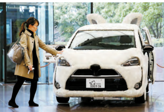
特朗普曾批評稱，日本車在美國普及，但美國車在日本的銷售情況不佳，這種情況「不公平」。

【香港商報訊】美國商務部的數據顯示，美國2016年對日本的貿易逆差為689.38億美元。逆差與上年基本持平，但超過德國，成為僅次於中國的第二位。