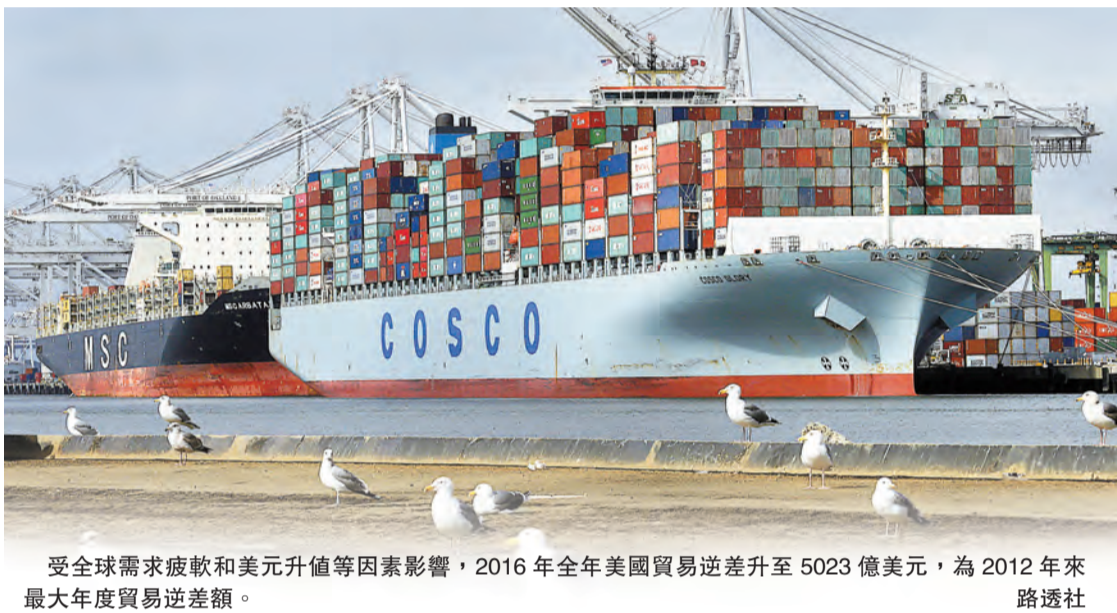
受全球需求疲軟和美元升值等因素影響，2016年全年美國貿易逆差升至5023億美元，為2012年來最大年度貿易逆差額。

【香港商報訊】美國總統特朗普政府最為敏感的貿易數據出爐：商務部周二公布報告指出，美國去年12月貿易逆差縮小3.2%至442億美元。雖然12月貿易逆差有些微縮減，但幅度仍不足，使去年全年貿易逆差達5023億美元（約合3.9萬億港元），創2012年來新高。有分析認為，這將為特朗普主張美國需更強硬的貿易措施增添柴火。