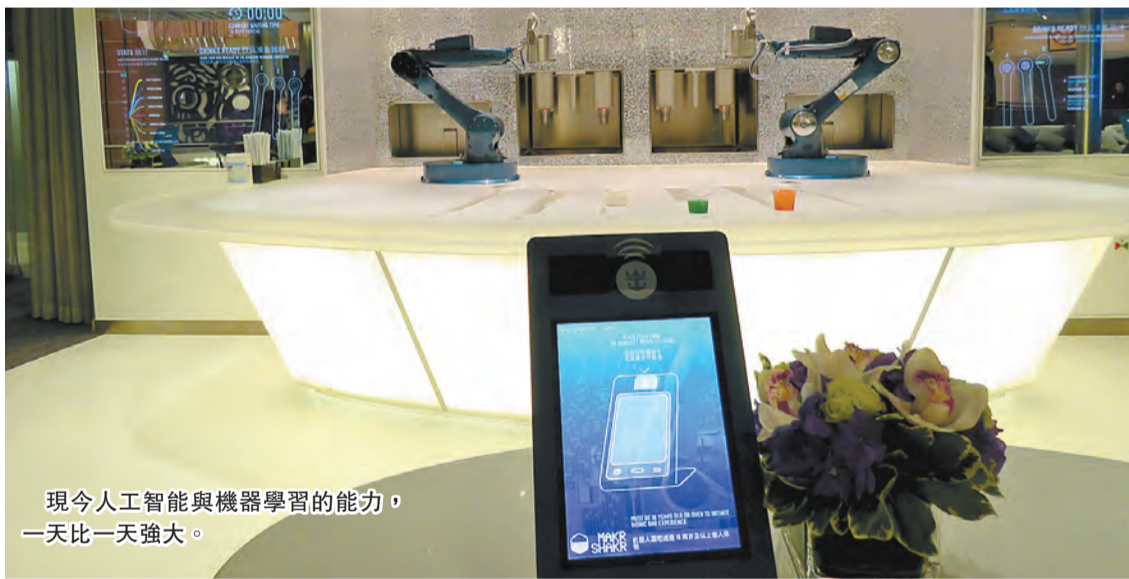
現今人工智能與機器學習的能力，一天比一天強大。