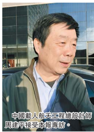
中國載人航天工程總設計師周建平接受本報專訪。

【香港商報訊】兩會採訪組報道：中國載人航天工程將安排新的一批航天員選拔和訓練，並且種類將從指令長、駕駛員的範圍，擴大到選拔飛行工程師、載荷專家等更多類型的航天員。全國政協委員、中國載人航天工程總設計師周建平向本報透露，在新一階段的選選中，港人一定會得到優先考慮，相信不久將來就會看到港澳人士加入載人航天的隊伍中。