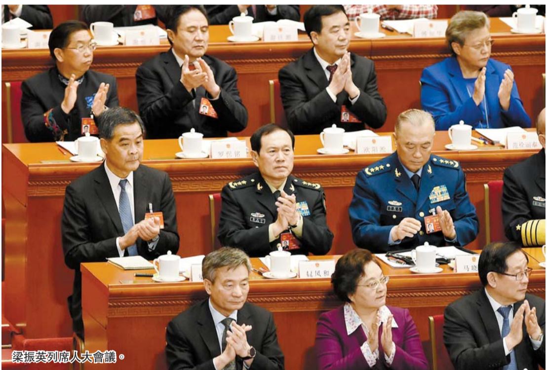
梁振英列席人大會議。