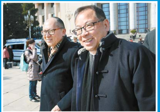
港區全國人大代表張明敏（右）與吳亮星一同離開。