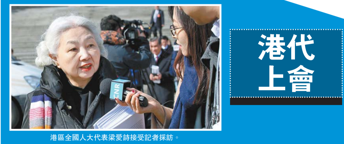
港區全國人大代表梁愛詩接受記者採訪。