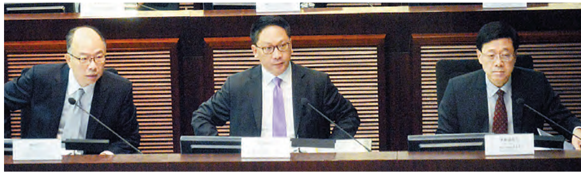
律政司司長袁國強(中)、運房局局長陳帆(左)及保安局局長李家超(右)，昨出席立法會事務委員會聯席會議解釋「一地兩檢」方案。

【香港商報訊】記者林駿強報道：立法會3個事務委員會昨日舉行聯席會議，再度討論高鐵香港段「一地兩檢」安排。律政司司長袁國強強調，「一地兩檢」合理、有必要性，最能發揮高鐵香港段的最佳效益；又明言「兩地兩檢」、車上檢等方法不可行；自己及其他官員都對「一地兩檢」的工作問心無愧，對得起歷史、立法會，以及香港特區。袁國強再次呼籲立法會議員支持「一地兩檢」。民建聯、經民聯等建制派議員都批評反對派「為反而反」，是與市民對着幹。