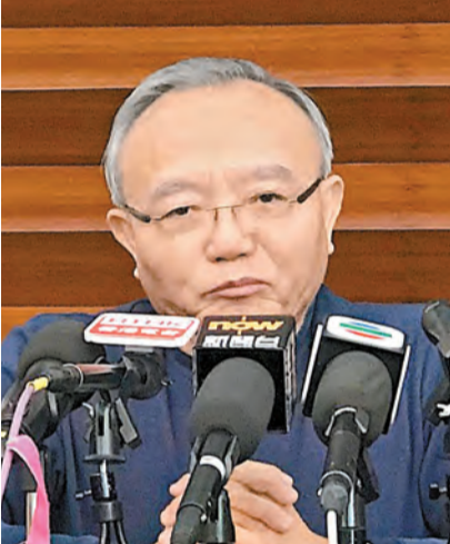
全國港澳研究會副會長劉兆佳認為要從「一國」角度看事情，不能將法律問題變成政治問題。

◀全國人大常委會港澳基本法委員會副主任張榮順表示，實行「一地兩檢」安排完全是維護香港發展利益的需要。