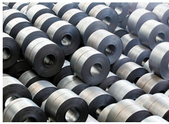
在亞洲，韓國是美國鋼鐵第三大進口來源國。

雖然直接影響有限，但特朗普使用「關稅大棒」的節奏太快，1月才剛剛對太陽能板和洗衣機下手，3月又劍指鋼鐵和鋁，而且計劃採取的關稅是一系列可選項中最為嚴厲的，這意味著貿易摩擦進一步擴大且持續的可能性已上升。大摩認為，如果貿易摩擦確實擴大且持續存在的話，對全球供應鏈的潛在破壞性影響將使得對貿易敞口較大的亞洲成為受影響最大的地區。長期來看，企業可能會重新評估對生產設施的選址決定。