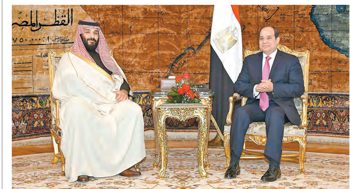
3月4日，埃及總統塞西（右）在開羅迎接沙特王儲薩勒曼。

沙特王儲薩勒曼當天造訪埃及，開始自去年獲任命王儲以來首次出訪。埃及總統塞西到機場迎接。一名沙特官員說，沙特將為聯合投資基金提供資金，幫助開發「新未來」項目在埃及西奈省的部分。薩勒曼去年10月發布「新未來」項目，打算在沙特西北部泰布克地區建造面積2.65萬平方公里的跨國特大城市和經濟特區。項目總投資5000億美元（約3.9萬億港元），是「沙特2030願景」經濟和社會改革計劃的一部分。約旦的部分國土也將納入「新未來」項目開發範圍。路透社報道，沙特與埃及共設投資基金，凸顯阿拉伯國家中財富第一大國與人口第一大國的戰略關係。埃及支持沙特打擊伊朗支持的也門胡塞反政府武裝。去年6月，埃及和沙特等海灣國家一道抵制尋求與伊朗改善關係的卡塔爾，塞西批准向沙特歸還兩座紅海島嶼。就在薩勒曼到訪前一天，埃及最高法院駁回所有針對「還島」協議的訴訟。除了經濟等領域強化雙邊關係，塞西和薩勒曼還討論了地區衝突和反恐事務。埃及總統府發言人拉迪說：「雙方確認將繼續合作對抗對地區事務的干涉以及在地區國家之間擴散不和及分裂的企圖。」