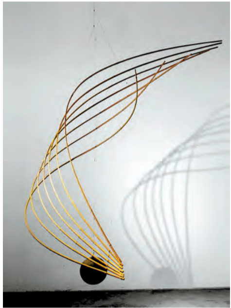
洛朗·馬丁作品，《颶風》，2017年。

內容：竹子給人感覺清高、挺拔，不但中國人對其有獨特的情感，連生於法國的藝術家洛朗·馬丁，簡稱「Lo」，都對竹子一見鍾情，甚至為此成爲一名全職藝術家。紅門畫廊舉辦展覽「竹氣」，是「Lo」在香港的首個個展，一系列全新創作的竹藝作品靈感源自藝術家在香港的旅程，展覽會展出其全新「帆船」系列作品，其中最矚目的是一件大型藝術動態雕塑《颶風》。觀者可從竹子本身的形態、竹與竹之間的無形空間和雕塑反射光線的陰影和輪廓仔細考量，感受竹子的魅力。 文：儀