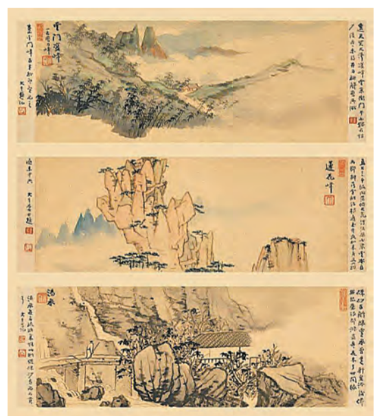
張大千作品，《大千黃山遊》，1933年。

日期：3月24日至4月5日 地點：中環鴨巴甸街35號元創方智方 時間：星期一至日上午11時至晚上8時 內容：「梅潔樓藏畫」被譽爲亞洲最具價值的19及20世紀中國水墨畫私人收藏之一，繼上年11月北京展覽後，將在香港開展，展出極少公開亮相的50件書畫作品，其中包括丁衍庸、居廉、陸儼少、張大千、馮儒等國畫大師作品。當中，手卷和冊頁各佔半數，均爲書畫作品的裝裱形式。爲了讓參觀者感受展覽的驚喜和探索的樂趣，手卷將打開放平，置於桌上，冊頁畫會裝裱在畫框，或將多幅繪畫按冊頁次序平鋪在陳列櫃內，以這兩種形式展出更彰顯水墨藝術的多元面貌。 文：儀