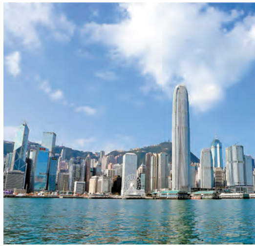
香港必須積極融入大灣區，才能再創輝煌。

香港繼續躊躇於自己倒退。香港兩條路線對壘的出路，只能是積極融入粵港澳大灣區，做大做强經濟才能緩解階級對立。