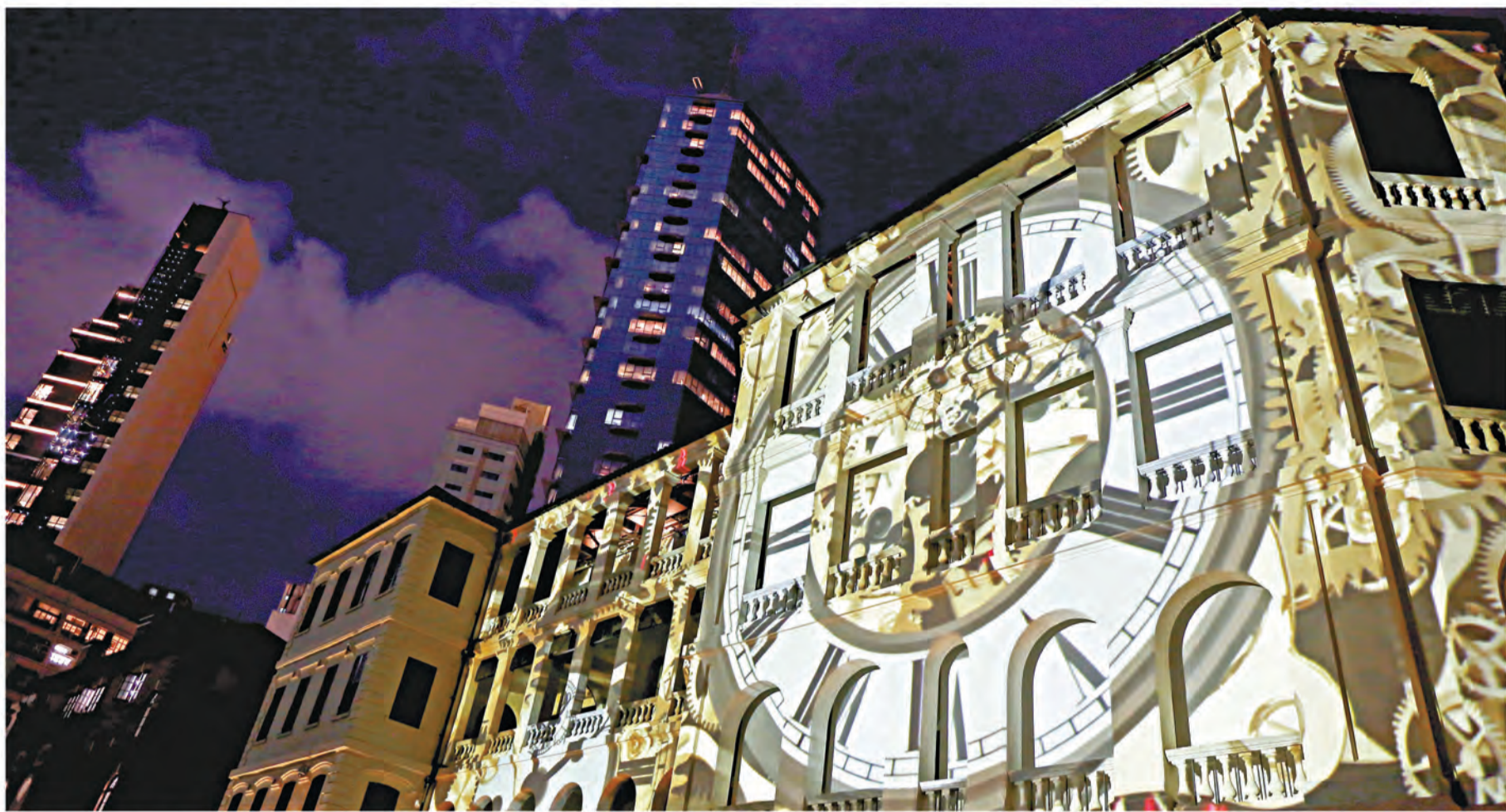
位於中區警署建築群的營房大樓，在大館的開幕典禮中上演光影匯演，閃耀迷人。

賽馬會文物保育有限公司諮詢委員會主席陳智思說：「大館位於中環的核心地段，是一個新舊交融、歷史文物與藝術結合的地方。在過去逾一個半世紀以來，大館重門深鎖，今天這地方已變成文化地標，鼓勵創意，並為社區及訪客帶來結合歷史文物、藝術和生活的新體驗。」