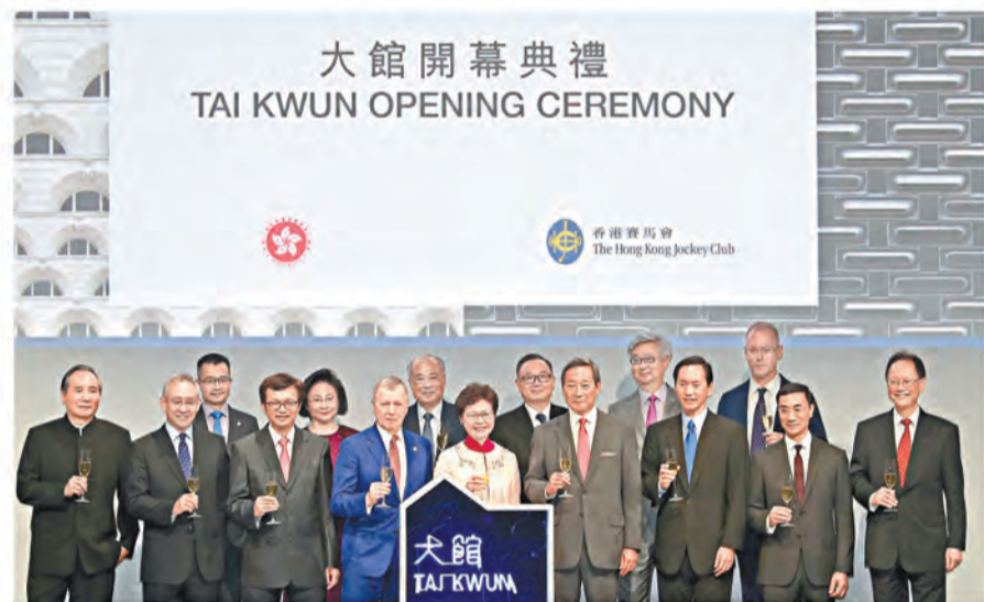
一眾馬會董事、香港特別行政區行政長官林鄭月娥及馬會管理層成員為慶祝大館開幕祝酒。