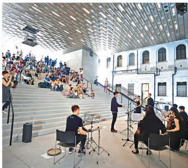
大館為訪客提供機會探索活化後的中區警署建築群。