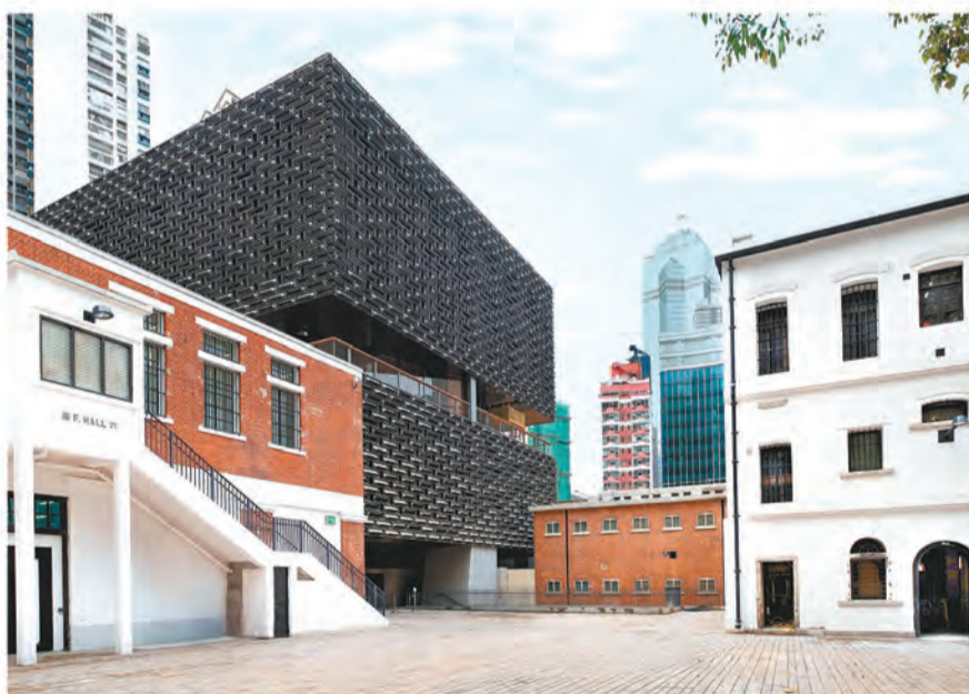
除了16幢歷史建築物外，活化後的中區警署建築群內亦有兩幢新建建築物：賽馬會藝方提供當代藝術展覽場地，賽馬會立方則設有綜藝館，可用作表演藝術、電影放映及教育等活動。大館由馬會屬下慈善信託基金成立的非牟利公司「賽馬會文物保育有限公司」負責管理及營運。