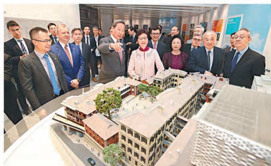
香港特別行政區行政長官林鄭月娥參觀《中區警署建築群風采再現——一次服務社群與活化古蹟的旅程》展覽，該展覽追溯馬會十年來在大館項目的投入。