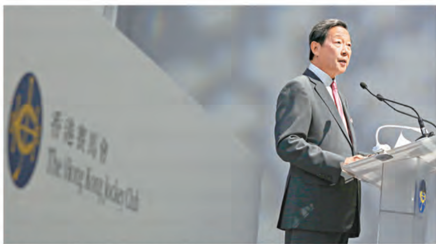
香港賽馬會主席葉錫安博士在中區警署建築群開幕禮致辭。