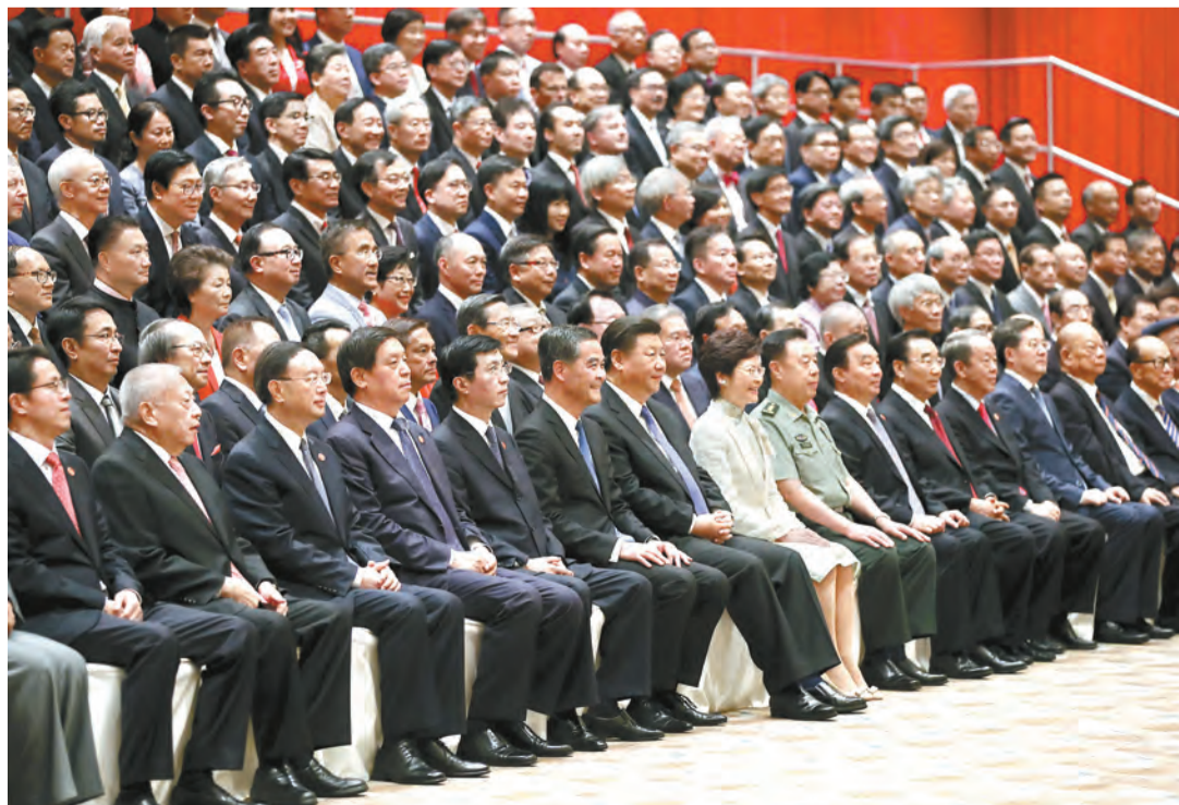
習主席和香港各界代表人士會見時拍下的大合照。

最後，他引用習主席講話與大家共勉。習主席去年7月1日在慶祝香港回歸祖國20周年大會暨香港特別行政區第五屆政府就職禮上指出「發展是永恒的主題，是香港的立身之本，也是解決香港各種問題的金鑰匙」，「香港背靠祖國、面向世界，有着許多有利發展條件和獨特競爭優勢。特別這些年國家的持續快速發展為香港發展提供了難得機遇、不竭動力、廣闊空間。香港俗語講：『蘇州過後無艇搭』，大家一定要珍惜機遇。」