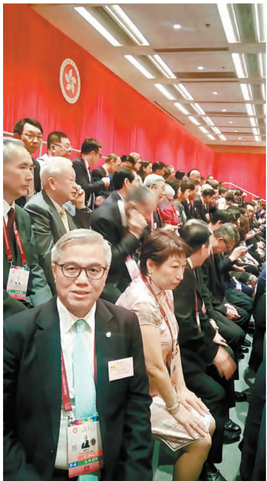
巢國明說，習主席接見各界代表人士時，現任律政司司長鄭若驊當時就坐在自己身邊。