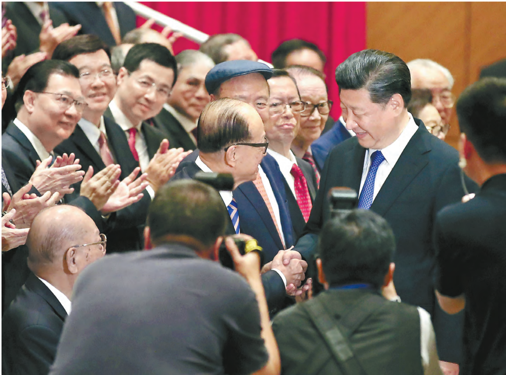
習主席和香港各界人士握手。

他讚揚林大在施政報告落實了減利得稅，寬減幅度較地在競選政綱中提出的更大，這對中小企業是很大的鼓舞。此外，財政司司長的財政預算案向中小企加碼注資25億元，其中15億元注入「BUD專項基金」，將資助地域範圍由內地擴大至東盟，協助本港企業升級轉型，以及向東盟拓展本地品牌。「這令商界有更大的發展空間。」