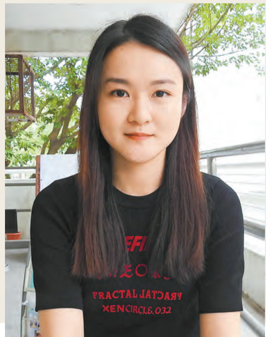
施小姐說，深切感受到一年來國家與香港的關係更緊密。