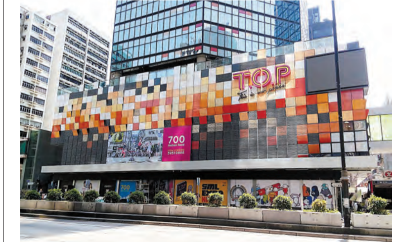
花旗個股首選領展(823)。

該行指，銀娛新項目第三和第四期的佔地達1000萬平方呎，與第一和第二期相若；第三和第四期提供4500間酒店房，較首兩期(3600間)更多。第三期包括會展等場地，第四期包括電競等項目。因而重申銀娛「買入」評級，並升至行業首選，目標價82元。