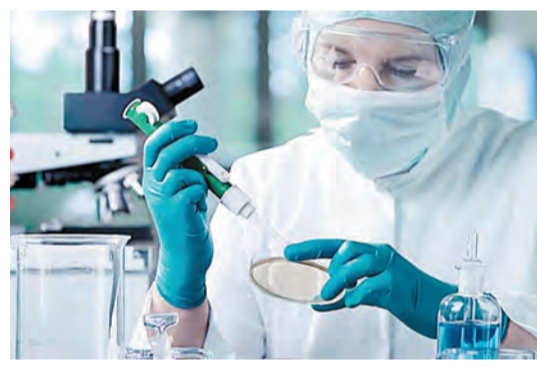
石藥收入料受新藥帶動。