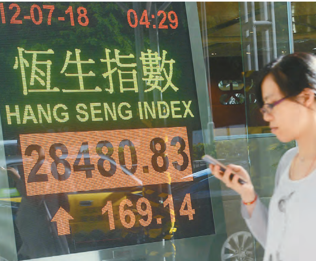
香港恒生指數昨日回升164點，收市報28480點。