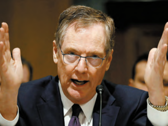
美國貿易代表 Robert Lighthizer 預計8月會就加徵關稅清單舉行公眾諮詢。